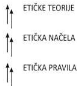
Slika 1. Etičke prosudbe

je osnova morala. Dok pitanje morala glasi ŠTO TREBA ČINITI?, etičko pitanje traži odgovor na pitanje ZAŠTO TREBAM ČINITI TO ŠTO TREBAM ČINITI? Etika pokušava odgovoriti na pitanje zašto treba činiti dobro i po čemu je dobro doista dobro - ona je filozofska refleksija moralnosti ljudskog djelovanja. Činjenje dobrog a izbjegavanje činjenja zla etičko je načelo, osnovno pravilo (uputa, mjerilo, naputak, obrazac, točan popis) ponašanja a u sklopu neke etičke teorije u društvenom ponašanju. U donošenju etičkog suda, odluke ili zaključka ("etičke prosudbe") sva tri spomenuta elementa (pravila, načela, teorije) su povezana i da na prosudbu imaju stanovit utjecaj. To možemo prikazati grafički na način kako je učinjeno na slici 1. U ovom je grafičkom prikazu /25/ kao što se vidi, zastupljena induktivna metoda koja polazi od pojedinačnog (pravila) i ide ka uopćavanju (teoriji). Međutim, u etičkom prosuđivanju moguć je i obrnuti put (deduktivna metoda), da se prosudba temelji na nekoj etičkoj teoriji (deontološkoj, militarističkoj, egzistencijalističkoj, stoičkoj itd.) i preko određenog etičkog načela vodi ka konkretnom etičkom pravilu (na primjer, ne kažnjavaj učenika).