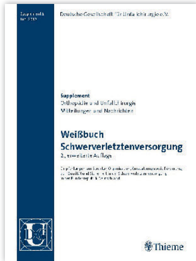
Abbildung 1 Weißbuch Schwerverletztenversorgung DGU