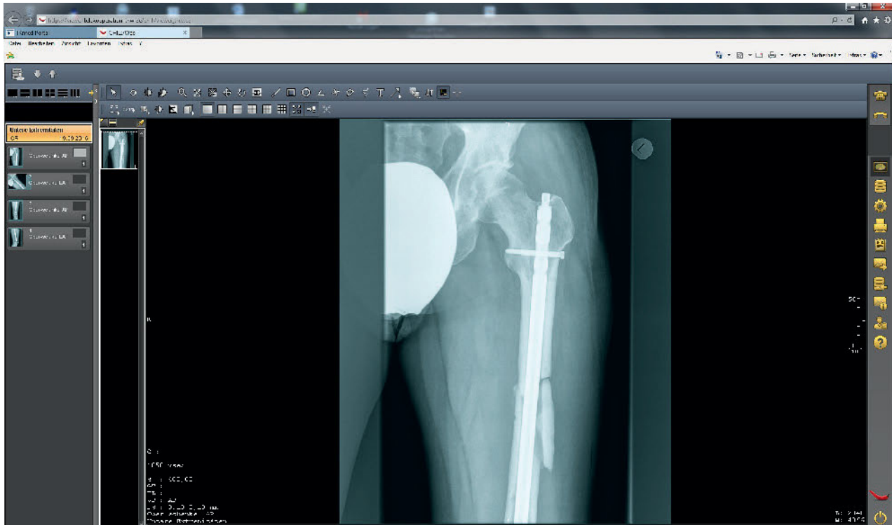
Abbildung 2 Bildbetrachtung per TKmed

mentierung der Telemedizin in deutschen Traumanetzwerken bei. Inzwischen sind über 500 Empfänger aller Versorgungsstufen an das System Telekooperation TNW/TKmed angebunden, darunter zahlreiche Universitäts- und BG-Kliniken [15]. Die AUC stellt federführend dieses schnittstellenkompatible und vor allem datenschutzkonforme teleradiologische System im Auftrag der DGU zur Verfügung, welches initial vom Universitätsklinikum Regensburg mit Projektnamen Exdicomed zwischen 2010 und 2012 entwickelt worden ist [10, 11].