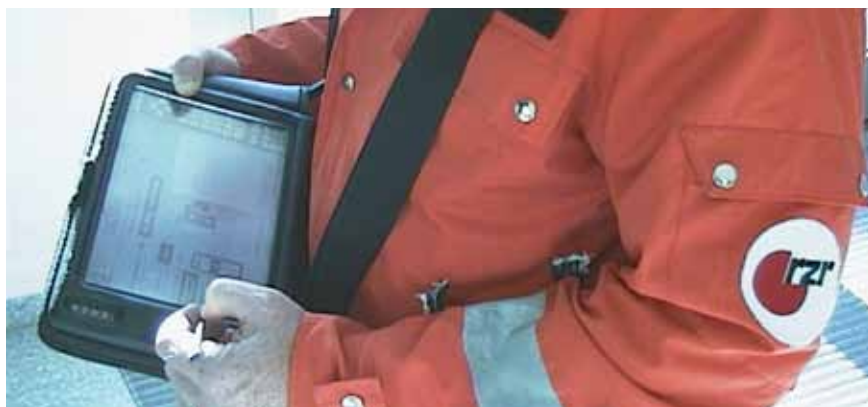
Abb. 1 NOAH im Einsatz ■Bitte Bildunterschrift prüfen■

Als Schwachstellen wurden in Ostbayern mittels einer systematischen Prozessanalyse vor allem die Informations-, Kommunikations- und Dokumentationsprozesse der präklinischen Versorgung gefunden. Informationsdefizite bestanden u. a. oft über den aktuellen Standort des Verletzten, das geschilderte Meldebild, die aktuelle Lage an der Einsatzstelle und über die Kapazitäten in den potentiellen Zielkliniken. Die Kommunikation verlief zum Teil unstrukturiert, verbal und über veraltete Technologien mit mäßiger Übertragungsqualität. Weite Informationswege über Notarzt, Rettungsassistent, Leitstellendisponent und Notaufnahmearzt hinweg führten zu Informationsverlusten und -verfälschungen. Die Dokumentation war aufwändig und redundant, dennoch unvollständig und ungenau, und darüber hinaus schwer auszuwerten. 2 Insbesondere an der Schnittstelle Prälink/Klinik erkannte man deutliche Zeit- und Informationsverluste, die sich als vermeidbar herausstellten. Um diese Probleme zu eliminieren, entwickelte die Abteilung für Unfallchirurgie des Universitätsklinikums