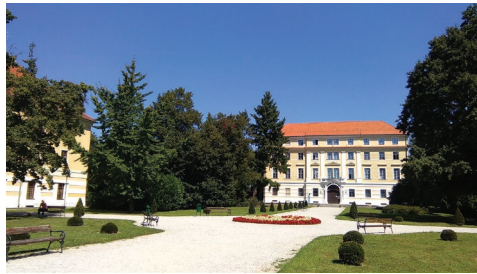
Sl. 2. Perivoj dvorca Batthyany-Strattmann, kolovoz 2016. godine.

četka 19. stoljeća. Nakon dvorca izgrađene su i dvije velike zidane zgrade na mjestu nekadašnjih drvenih objekata čime je oblikovano dvorište s južne strane koje je tijekom 19. stoljeća dodatno zatvoreno kamenom ogradom. 6 Moгуće je da su u tom razdoblju zasađene prve sadnice ukrasnog drveća oko dvorca i formirane staze-šetnice.