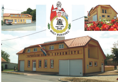
Sl. 4. Sadašnji vatrogasni dom Društva, izgrađen 1931. i obnovljen 2007. godine, jedan je od najljepših u Podravini

kuće u Malom Bukovcu, ugašenom od strane Društva, ugušio se gluhonijemi sin vlasnika. U narednih 30-ak godina članovi Društva gasili su požare u Župancu, Selnici, Svetom Petru, Velikom Bukovcu (1927. godine zbio se najtragičniji požar u povijesti ludbreške regije u kojem je 26 kuća i 57 raznih gospodarskih objekata pretvoreno u prah i pepeo, a 127 osoba ostalo je bez krova nad glavom), Cvetkovcu,