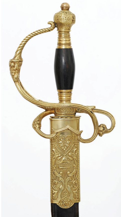
Sl. 2. Restaurirane 2 časnicike kacige i 3 sablje, prijelaz 19./20. st.

kuće u Malom Bukovcu, ugašenom od strane Društva, ugušio se gluhonijemi sin vlasnika. U narednih 30-ak godina članovi Društva gasili su požare u Župancu, Selnici, Svetom Petru, Velikom Bukovcu (1927. godine zbio se najtragičniji požar u povijesti ludbreške regije u kojem je 26 kuća i 57 raznih gospodarskih objekata pretvoreno u prah i pepeo, a 127 osoba ostalo je bez krova nad glavom), Cvetkovcu,