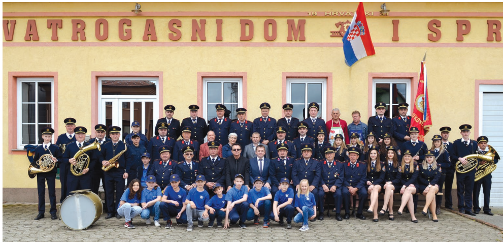
Sl. 7. Zajednička fotografija članstva DVD-a Mali Bukovec na Florijanovo 2017. godine