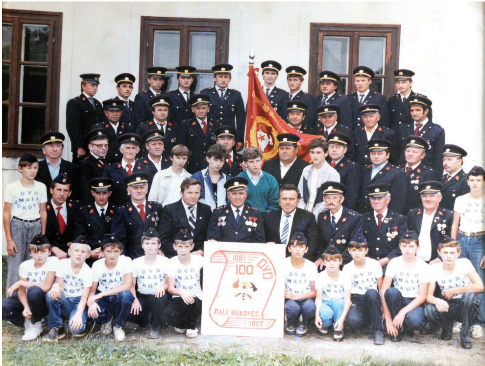
Sl. 1. Članstvo Društva prigodom svečanog obilježavanja 100. obljetnice osnutka 1987. godine