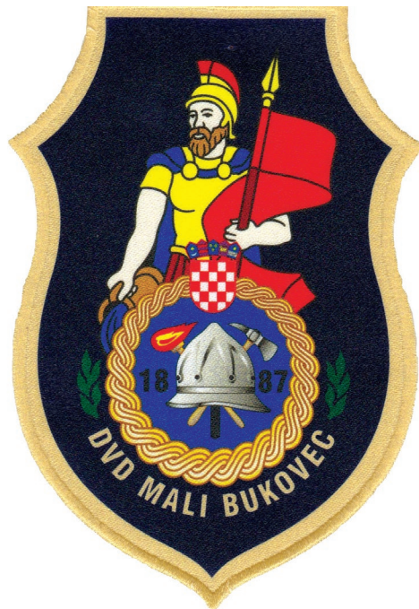
Sl. 3. Današnji amblem DVD-a Mali Bukovec, ujedno i središnji motiv grba odnosno zastave Općine Mali Bukovec.

Novom Selu, Ludbregu, Pustakovcu, Kutnjaku, Donjem Kraljevcu (1924. godine, izgorjela 373 objekta od 109 vlasnika), Koprivničkom Ivancu (1934. godine, izgorjele 2 kuće i 6 štagljeva) i Lunjkovcu. Pritom valja spomenuti i gašenje požara u više kuća te gospodarskih objekata koji su zadesili Mali Bukovec u travnju 1945. godine uslijed bombardiranja naselja požarnim granatama. Najvrednija akcija toga razdoblja je svakako izgradnja prvog vatrogasnog doma kojima se Društvo i danas služi. Uz sve poteškoće, 1931. godine, izgrađen je vatrogasni objekt, kao zasigurno najljepši onodobni vatrogasni objekt u širem kraju. Inicijatori gradnje bili su August Weiss, Alojz Lajner, Karlo Šartaj, Karlo Repić, Rok Havaić i mnogi drugi mještani, odnosno članovi tadašnjeg vatrogasnog društva. Valja spomenuti da je drvo za krovnu konstrukciju doma darovao pokrovitelj grof Pavao Drašković, dok je preostali potreban materijal nabavljen dobrotvornim priložima mještana sela, odnosno sredstvima Društva. Novosagrađeni vatrogasni dom davao je moralni impuls članovima Društva koji su ga koristili za stalno usavršavanje i podizanje stručnosti zbog čega su uvi-