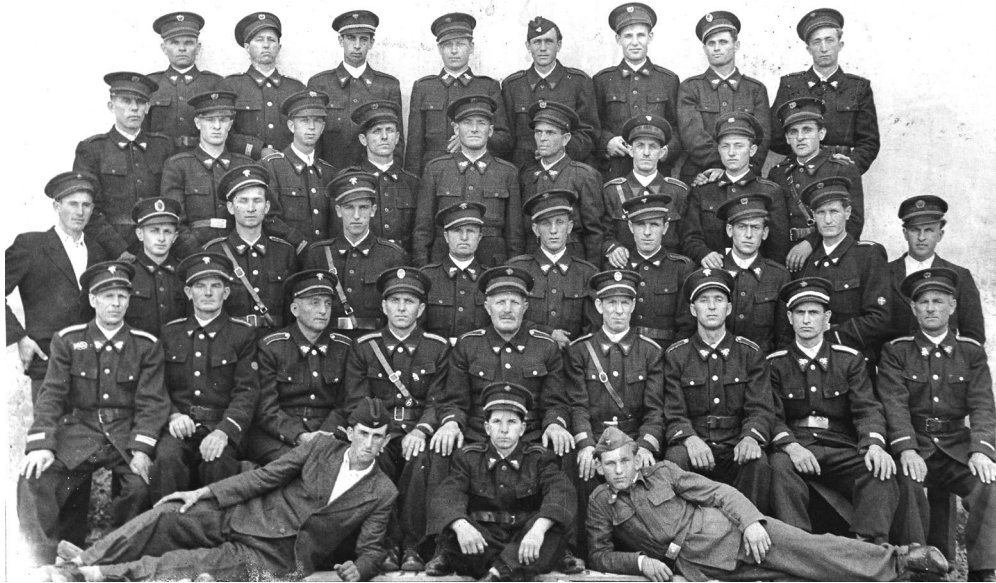
Sl. 6. Zajednička fotografija Upravnog odbora i momčadi iz 1952. godine kada se okupilo čak 370 vatrogasaca

članova, ali i trzavica među članstvom koje su nakon kratkog vremena prevladane. Narodna vlast pomaže vatrogastvo, što je vidljivo na cijelom području, ali i u samom Društvu. Valja napomenuti kako su vatrogasne organizacije bile vrlo cijenjene, u manjim mjestima često i jedine društvene organizacije, stoga je inicijativa glede promocije socijalističkih temelja društvene zajednice putem dobrovoljnih vatrogasnih društava bila izrazito jaka. Već 1951. godine Društvo je naraslo na 44 izvršujuća člana, a učlanjuju se i 144 podupirajuća člana. Organizacijski uređeno, Društvo je željelo i nadalje napredovati u smislu opremljenosti modernijom opremom. Naime, brz razvoj tehnike rasplamsavao je želju članstva za suvremenijim prijevoznim sredstvom zbog brže intervencije. Godine 1950. nabavljen je rabljeni automobil za prijevoz ljudi i opreme marke Steyr . Društvo ubrzo ni time nije zadovoljno, pa se isti automobil 1953. godine mijenja za veći i brži (nabavljen na dražbi Jugoslavenske narodne armije). Međutim, nakon izvjesnog vremena uviđa se da automobil predstavlja velik financijski teret za Društvo, stoga je donesena odluka o njegovoj prodaji. Usluge prijevoza opreme i ljudi u potrebnim situacijama nadalje provodi ponajprije tadašnja poljoprivredna zadruga, a kasnije vlasnici traktora u