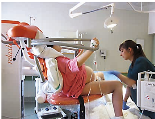
Figur 1. Förlossningsstol. Notera moderns och barnmorskans ställning.