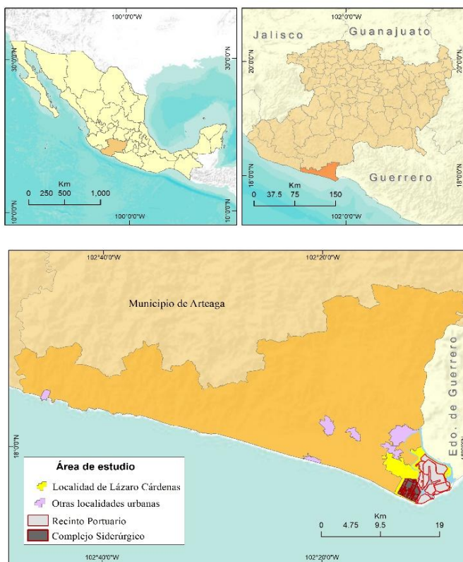
Mapa 1. Localización Geográfica del municipio, ciudad y puerto de Lázaro Cárdenas