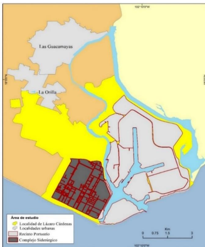
Mapa 2. Localización del recinto portuario de Lázaro Cárdenas y el Complejo Siderúrgico Lázaro Cárdenas-Las Truchas

En este orden de ideas retomando a Martínez (2012) este específica que se forman, los ya mencionados dos circuitos económicos. Por un lado, el de los grandes establecimientos localizados en el puerto, vinculados al comercio global y las empresas transnacionales con considerables capitales. En contraste el otro circuito el de la ciudad formado por micro y pequeñas empresas (MiPyME) sin presencia en el recinto portuario que son más bien para el consumo de la población local que trabaja para el puerto y es asalariada y lo que parece más destacable para este autor, no se advierten enlaces productivos entre los dos circuitos. Cada uno se circunscribe específicamente en zonas contiguas pero delimitadas, cada conjunto de las empresas, micro, pequeñas y grandes se ubican en espacios específicos ( Mapa 2 ).