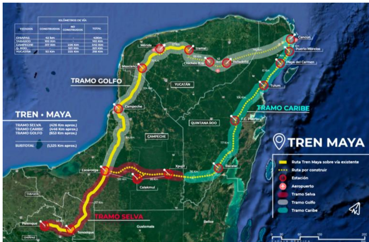
Figura 1. Recorrido del Proyecto Tren Maya. AMLO (2018).

Se presenta una imagen del recorrido que se tiene planteado que realizará el Tren Maya, así como sus respectivas paradas y la simbología que representa las vías existentes, lo que falta por construir, así como los tramos de Selva, Golfo y Caribe.