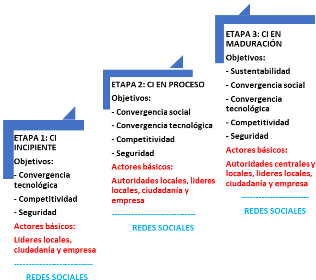
Figura 2. Modelo de la Ciudad Inteligente (CI) 3 - Escalable para los países emergentes