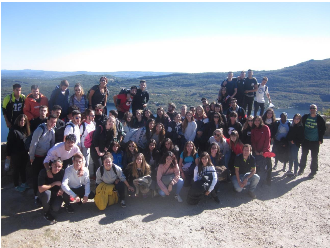
Figura 4. Fotografía del alumnado y del profesorado en el itinerario didáctico por el Lago de Sanabria y alrededores.