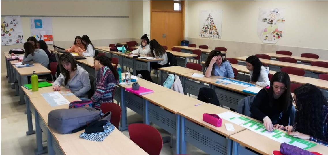
Figura 3. Alumnas trabajando con un modelo físico del tiempo.