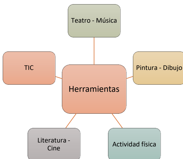
FIGURA 3. HERRAMIENTAS

El desarrollo de los contenidos se llevarán a cabo a través de las siguientes herramientas