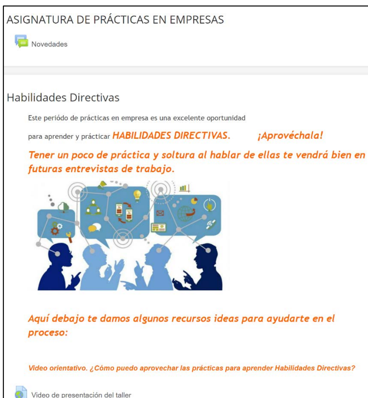
Figura 1. Introducción a la Actividad y Video de presentación del taller en Studium.

El video realizado está disponible en el siguiente enlace: