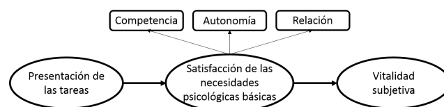
Figura 1. Representación del modelo estructural hipotetizado.

El objetivo principal de esta investigación fue estudiar, desde los planteamientos de la miniteoría de la BPNT (Deci y Ryan, 2002), las interrelaciones entre la presentación de las tareas (PT) por parte del profesor como factor social, las necesidades psicológicas básicas (NPB: autonomía, competencia y relación) como factores mediadores personales, y la vitalidad subjetiva (VS) en el contexto de la educación física. Todo esto, a través de la comprobación de un modelo teórico con la secuencia PT→NPB→VS (fig. 1), en el que se plantean las siguientes hipótesis: 1) la presentación de las tareas por parte del profesor será un predictor positivo de la satisfacción de las necesidades psicológicas básicas; 2) la satisfacción de NPB será un predictor positivo de la vitalidad subjetiva, y 3) la satisfacción de las NPB mediará la relación entre la presentación de las tareas por parte del profesor y la vitalidad subjetiva descrita por el alumno. Aunque esta relación ha sido estudiada en el contexto del deporte (e.g., Garza-Adame et al., 2017), la investigación es escasa en el contexto de la educación física, y la necesidad de su estudio ha sido puesta de manifiesto (e.g., Vlachopoulos, Katartzi y Kontou, 2011).