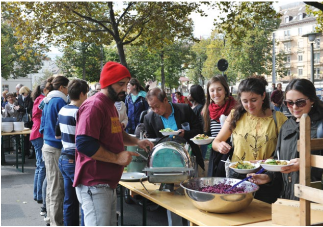
Event-Woche «Zürich isst».