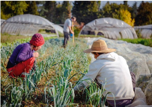
Feldarbeit einer Initiative für Regionale Vertragslandwirtschaft in Genf.