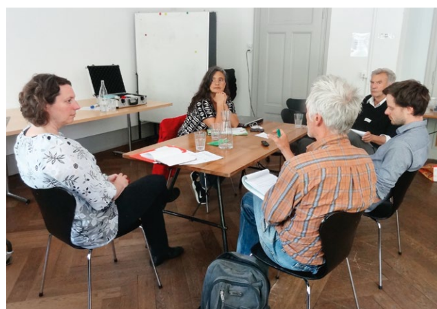
Gruppendiskussion im Expertenworkshop «Stadt und Landwirtschaft – Erneuerung des Dialogs» vom 14. Juni 2018.

Am 14. Juni 2018 trafen sich rund 25 Fachleute aus Verwaltung, Forschung und Praxis, aus Stadtentwicklung, Raumplanung und Landwirtschaft zum Expertenworkshop «Stadt und Landwirtschaft – Erneuerung des Dialogs» in Bern – organisiert in einer Kooperation der akademischen Gesellschaften saguf, Schweizerischen Gesellschaft f r Agrarwirtschaft und Agrarsoziologie (SGA) und Schweizerische Gesellschaft f r l ndliche Geschichte (SGLG). Die Fachleute diskutierten einen Tag lang Handlungsfelder und L sungsans tze f r eine nachhaltigere Gestaltung des Ern hrungssystems, mit einem speziellen Fokus auf der F rderung des Dialogs zwischen Stadt und Landwirtschaft. Das vorliegende Papier fasst die Ergebnisse zusammen und m chte damit die Dis-