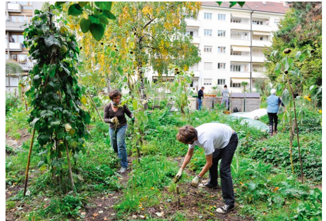
Gemeinschaftsgarten Landhof in Basel.

Im Expertenworkshop «Stadt und Landwirtschaft – Erneuerung des Dialogs» wurde diesem Potenzial von Städten Rechnung getragen. Es kristallisierten sich drei Handlungsfelder heraus, die im folgenden Kapitel diskutiert werden.