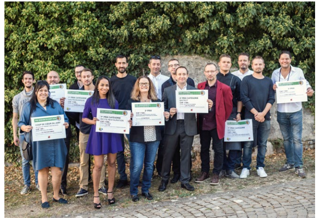
Preis im Kanton Genf für nachhaltige und innovative Gastronomen im Rahmen der «semaine du goût 2018» – Zeremonie der Siegerehrung.

indem sie innovative Formen der Vermarktung suchen, eigene Verarbeitungsstufen und Vermarktungsstrukturen aufbauen oder vermehrt Kooperationen untereinander oder mit Bürgerinnen und Bürger wie auch mit den regionalen, handwerklich-gewerblichen Verarbeitern suchen. Beispiele hierfür sind u.a. Bauernmärkte, Kooperationen von Konsumenten und Konsumentinnen mit Landwirten und Landwirtinnen im Rahmen der Regionalen Vertragslandwirtschaft (RLV) 2 , das Modell des partizipativen bäuerlichen Supermarkts wie es in Genf mit la Fève umgesetzt wurde oder kollektive Produzentenverkaufsstellen wie z.B. « Dorigno » bei Nyon. Aber auch Foodcoops, Erzeuger-Verbraucher-Genossenschaften, z.B. der Hallerladen in Bern, und städtische Schreber- oder Gemeinschaftsgärten zählen hier dazu. Doch ungeachtet deren zunehmenden Beliebtheit, treffen diese konkreten Entwicklungen und teils bottom-up-Aktivitäten auf verschiedene Schwierigkeiten, welche eine Breitenwirkung auf das bestehende Ernährungssystem verhindern. Eine grosse Schwierigkeit hier sind gewisse gesetzliche Rahmenbedingungen in der Raumplanung, zu Hygienevorschriften und des Kartellrechts, welche primär auf die Bedürfnisse industrieller Verarbeitung ausgerichtet sind und den Aufbau dezentraler, regionaler und kleinerer Vermarktungs- und Verarbeitungsstrukturen sowie Kooperationen zwischen Produzenten behindern.