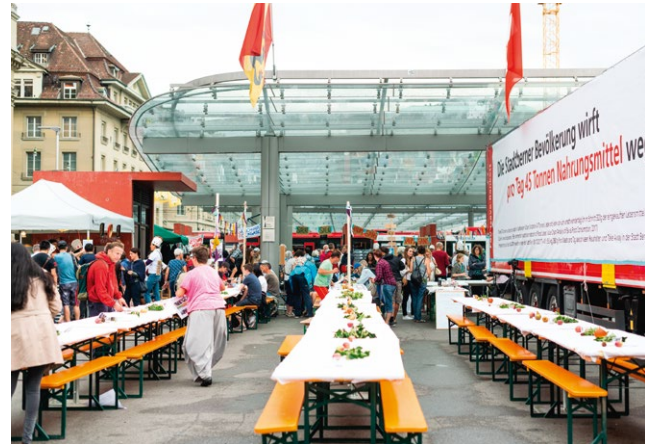
Food-Safe-Bankett als Abschlussveranstaltung der «Kulinata-Woche» 2018 in Bern.