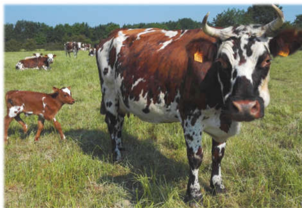
Vaches avec leurs veaux au pâturage, Loire Atlantique

Parmi les éleveurs enquêtés, 4 d'entre eux laissent les veaux avec leur mère biologique sur une courte période (entre 15 et 45 jours) avant de repasser à un allaitement artificiel. Garantir la santé des animaux et leur bien-être, ou diminuer l'astreinte de travail sont autant de raisons avancées par les éleveurs pour justifier leur pratique. Pour ne pas compromettre la production laitière, le veau est séparé de la mère avant son sevrage lacté. Il peut ensuite refuser de se nourrir pendant au maximum une journée avant d'accepter un autre système d'allaitement. Quant à l'utilisation des vaches nourrices, les éleveurs trouvent cela trop contraignant et pensent ne pas avoir le parcellaire, le bâtiment ou les animaux nécessaires pour mettre en place cette pratique.