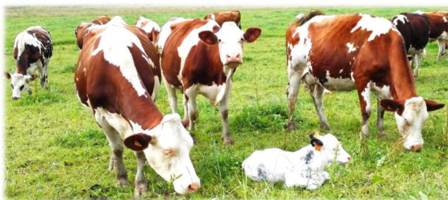
Veaux sous la mère pâturant avec le troupeau laitier, Lorraine

Améliorer le bien-être des animaux en élevage constitue actuellement un enjeu majeur, en réponse aux attentes des citoyens et consommateurs. En agriculture biologique, des réflexions sont en cours pour faire évoluer les pratiques d'élevage et ainsi permettre aux animaux d'exprimer au mieux leur comportement naturel. L'élevage des veaux en système laitier constitue un des points d'attention. En effet, pour l'heure, la séparation des veaux avec les mères reste la pratique la plus courante mais de nouvelles conduites d'élevage, qui privilégient le lien maternel, apparaissent. Mieux connaître ces pratiques, pour identifier les conditions auxquelles elles peuvent être adoptées par un nombre plus important d'éleveurs, a constitué le but d'une enquête menée au printemps 2018 auprès d'éleveurs bios qui élèvent les veaux avec des vaches adultes.