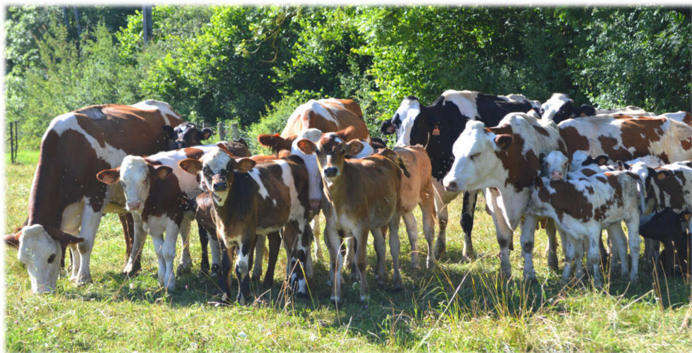
Vaches nourrices et leurs veaux au pâturage, ferme expérimentale de Mirecourt, Vosges

Les facteurs exogènes favorisant les maladies infectieuses et digestives (tétine, température et quantité de lait) sont désormais mieux contrôlés. La mise au pâturage précoce des veaux avec les vaches favoriserait l'immunité des jeunes. C'est pourquoi, d'après les éleveurs, les veaux issus de ces élevages sont globalement en bonne santé. Aucun traitement n'est réalisé pour enrayer des cas de diarrhées ou le développement de parasites. Il y a donc moins de jeunes animaux malades et donc moins de frais vétérinaires occasionnés.