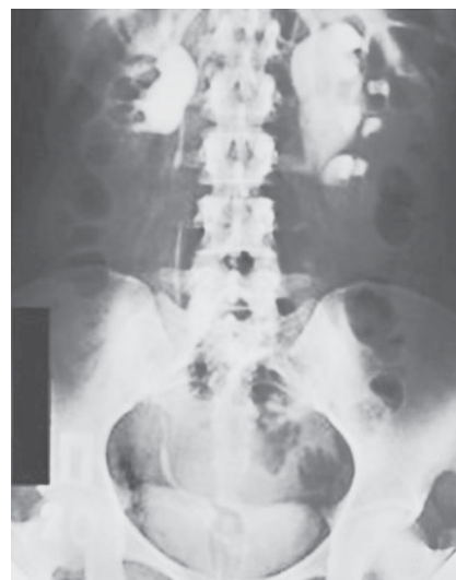
Рис. 2. Врожденный гидронефроз. Экскреторная урограмма

Прогноз зависит от степени антенатального гидронефроза, своевременности оперативного