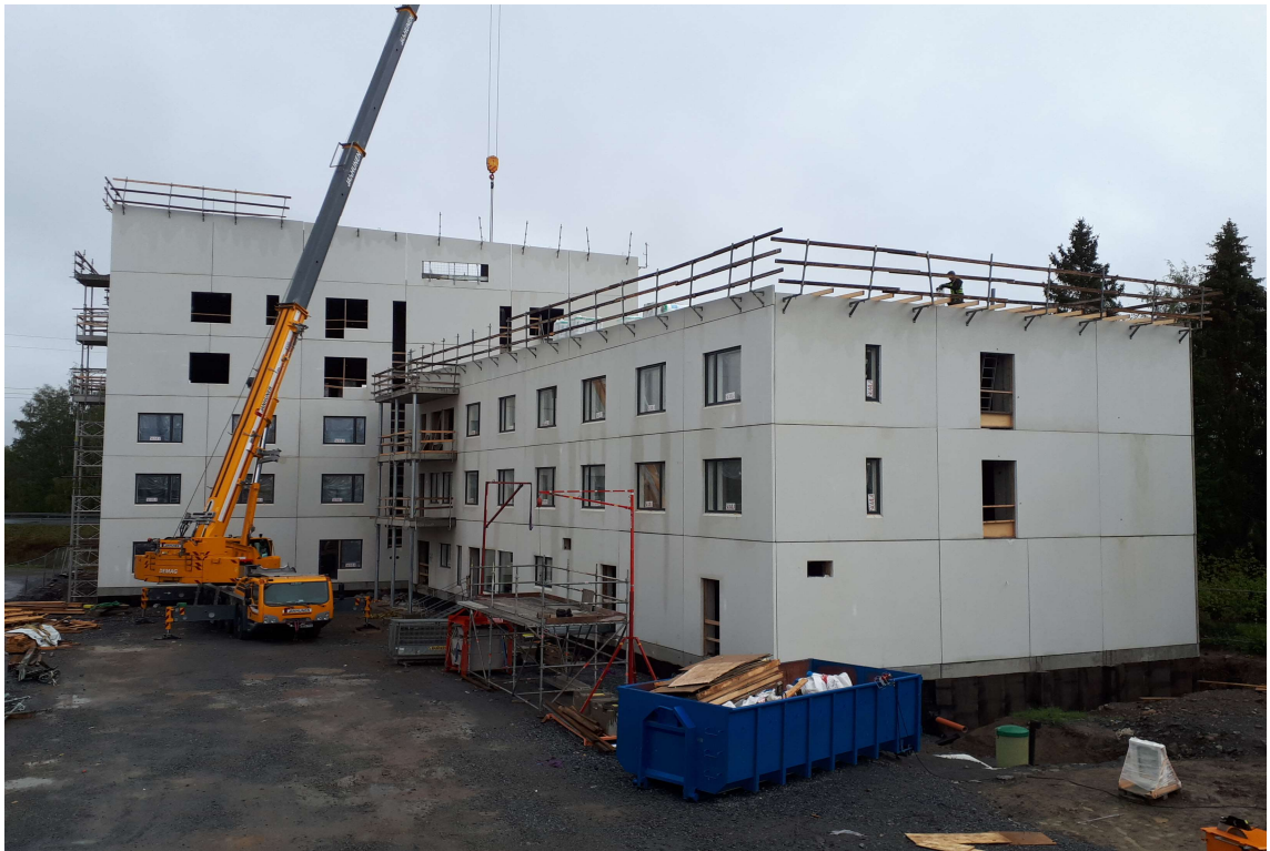
Kuva 1. Senioritalo runko lähes valmiina.