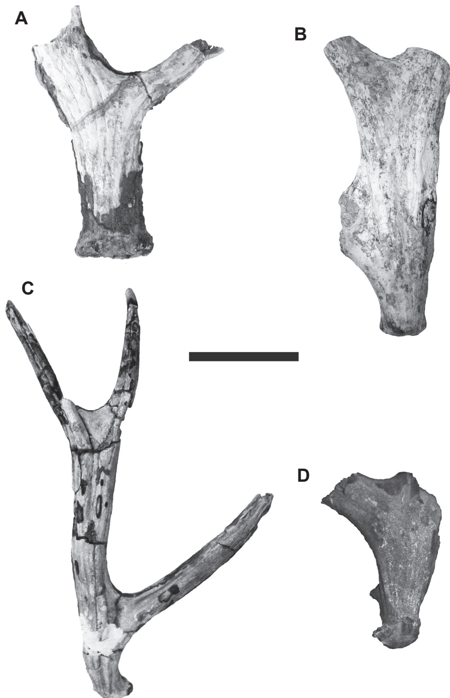
Figura 2. Porciones de astas de Antifer en vista externa. A , A. ensenadensis , CTES-PZ 7486, asta derecha. B , A. ultra , CTES-PZ 7160, asta izquierda; C , CTES-PZ 7367, asta derecha; D , CTES-PZ 7290, asta izquierda. Escala = 10 cm.

Figure 2. Partial antlers of Antifer in external view. A , A. ensenadensis , CTES-PZ 7486, right antler. B , A. ultra , CTES-PZ 7160, left antler; C , CTES-PZ 7367, right antler; D , CTES-PZ 7290, left antler. Scale bar = 10 cm.