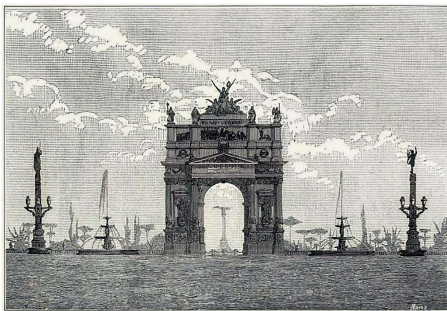
Figura 2. Proyecto de Arco de Triunfo al Libertador. Mariano Santamaría. Grabado de Moros. Fuente: (Urdaneta, 1884)