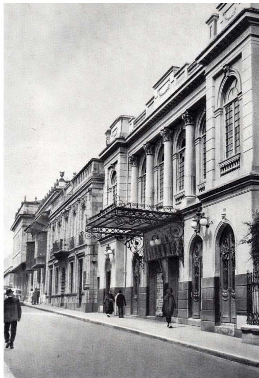
Figura 4. Teatro Municipal Bogotá. Arquitecto Mariano Sanz Santamaría. Construido entre 1887 y 1890. Demolido en 1952.