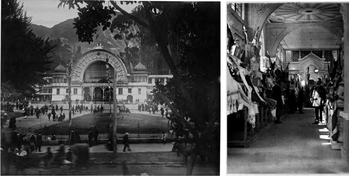
Figura 5. Pabellón Central o de la Industria 1910. Mariano Santamaría y Escipión Rodríguez. Foto exterior e Interior. Nieto, Clímaco. Fuente: (Pecha Quimbay, 2013, págs. 126-156)