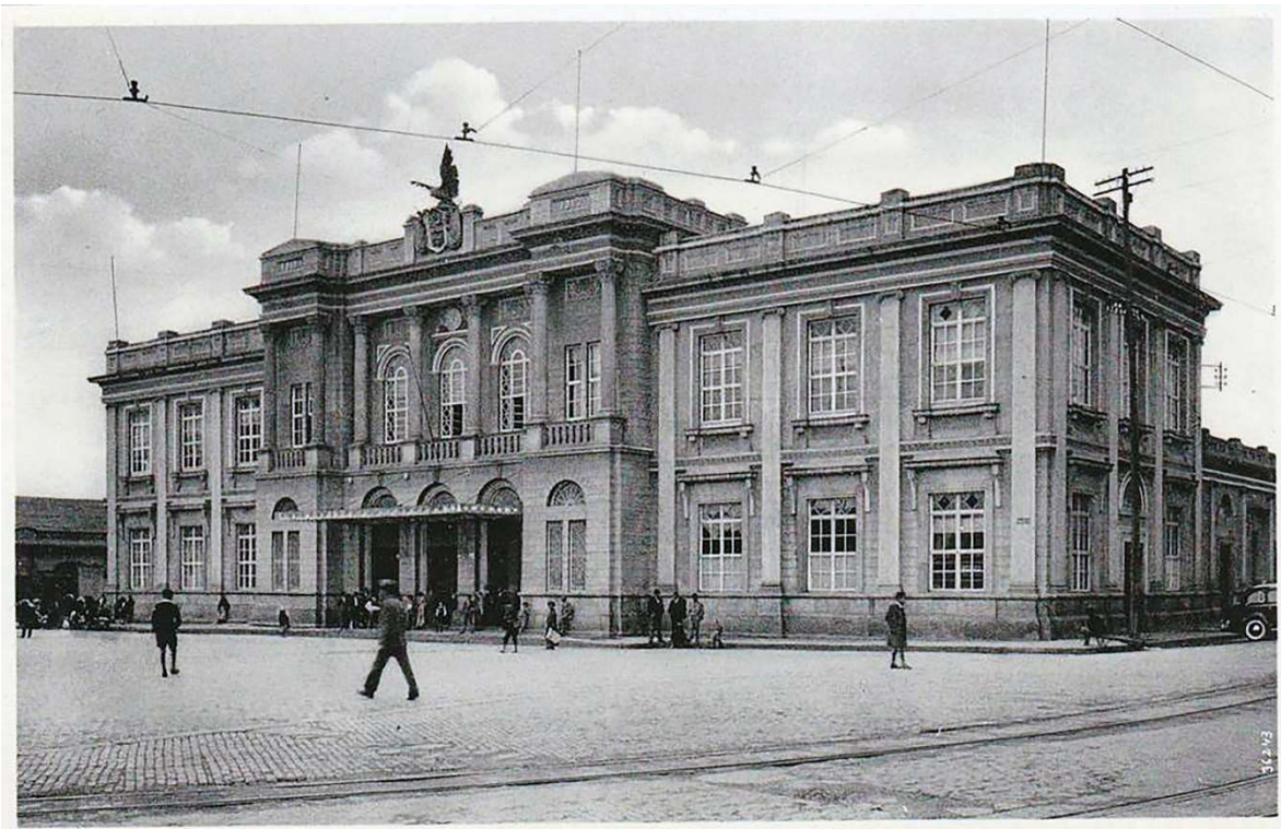
Figura 6. Estación del Ferrocarril de la Sabana (1913-1917).