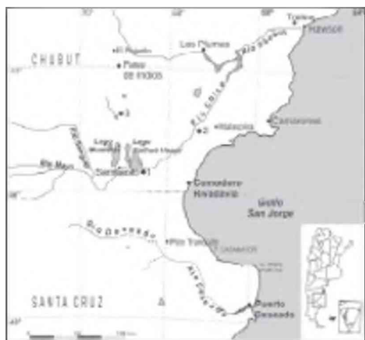
Fig. 1. Zona centro-oriental de las provincias de Chubut y Santa Cruz, mostrando el área general de distribución de los principales yacimientos paleógenos prospectados por Carlos Ameghino. 1, Gran Barranca; 2, Cabeza Blanca; 3, Cerro del Humo.