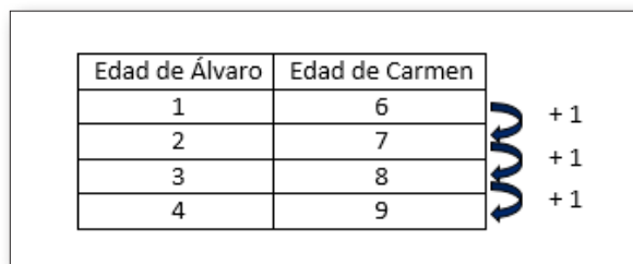
Fig. 1. Patrón recursivo.

implica el pensamiento funcional. La recurrencia es la relación que se define con base en los valores de un mismo conjunto de valores (Johsonbaugh, 2005). Esta relación es la más elemental y describe una variación entre las cantidades de una secuencia de valores e implica obtener una cantidad en una secuencia a partir del número o números previos. Un ejemplo de este tipo de relación se aprecia en un problema en el que una niña (Carmen) tiene cinco años más que otro niño (Álvaro) (función y = x + 5 ). Al proponer al alumno completar una tabla de funciones donde debe encontrar la edad de Carmen, la completa observando hacia abajo los valores de la variable dependiente (edad de Carmen), en este caso sumando uno a la cantidad anterior, como se observa en la figura 1. Además, cuando se le pregunta cómo obtuvo la edad de Carmen, el alumno responde «sumando de uno en uno».