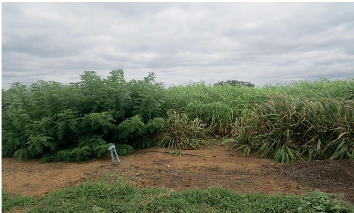
Figura 12. Glicírdia e capim elefante irrigados com água salobra.