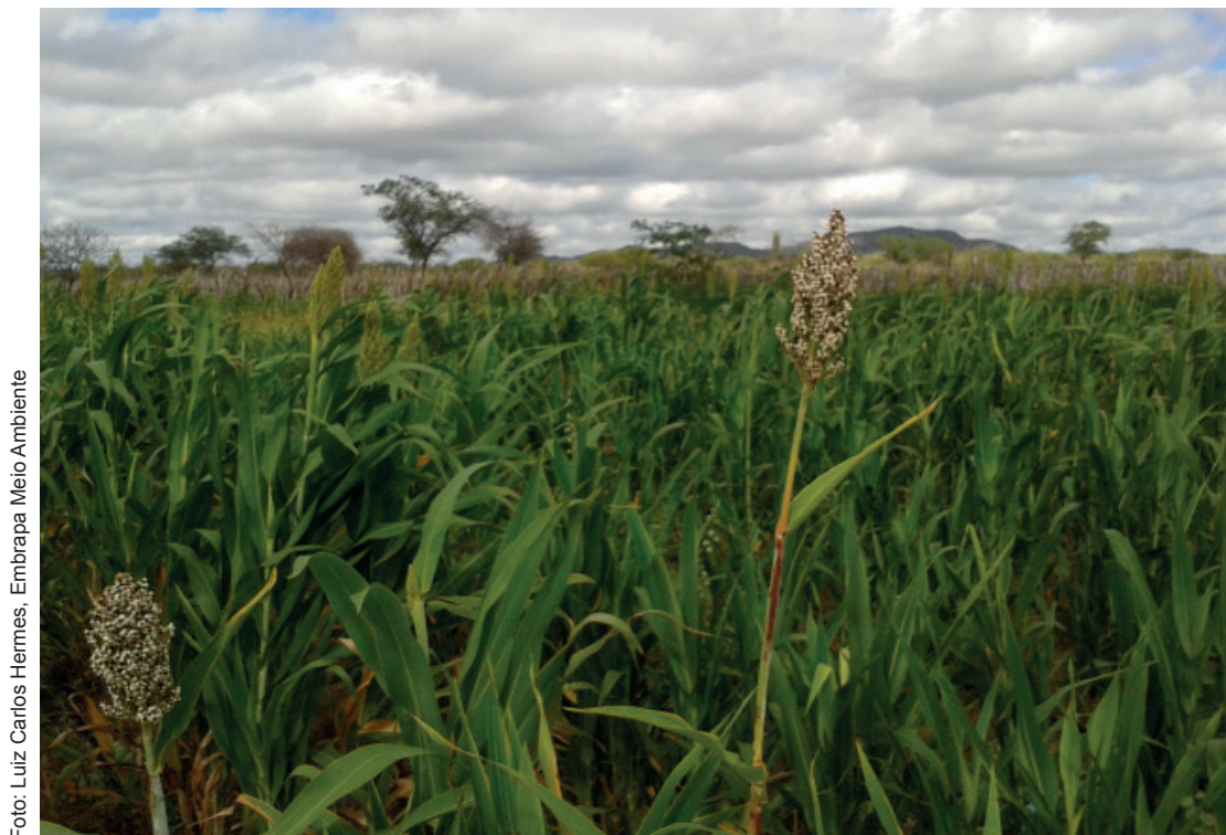
Figura 14. Sorgo forrageiro ( Sorghum bicolor L. Moench), irrigado com água de poço em área de produtor rural no município de Petrolina (PE).