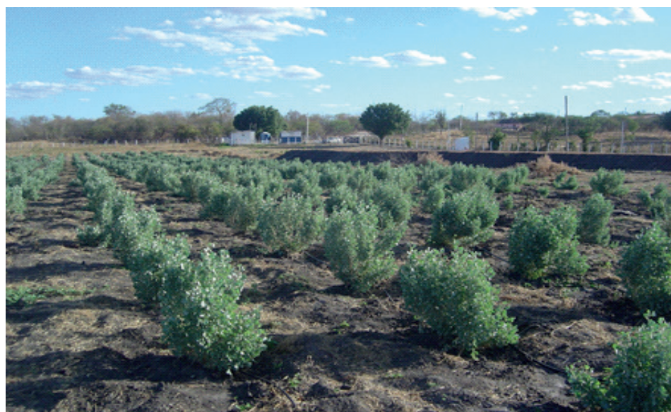
Figura 8. Erva-sal ( Atriplex numulária ) irrigada com água salina.