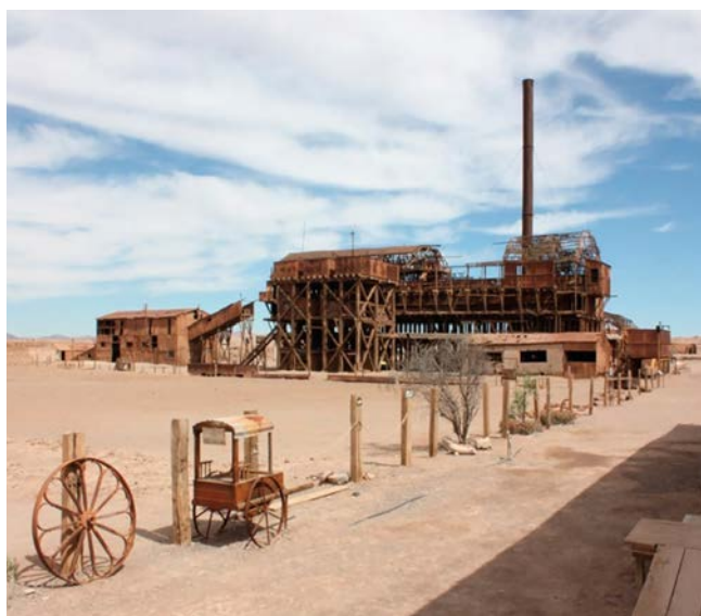
Figura 1. Torre de lixiviación de la oficina salitrera Santa Laura.

En los mismos lugares en los que se desarrolló la medición resistográfica se realizaron, como complemento del estudio, mediciones de velocidad de propagación de ondas de ultrasonido y contenido de humedad. Las mediciones de ultrasonido fueron efectuadas en forma directa y en el plano perpendicular a las fibras y en forma indirecta y en el sentido longitudinal a las fibras. Las mediciones de velocidad de propagación de ondas de ultrasonido se determinaron mediante un equipo James Instruments Inc. modelo V-meter MKIV con