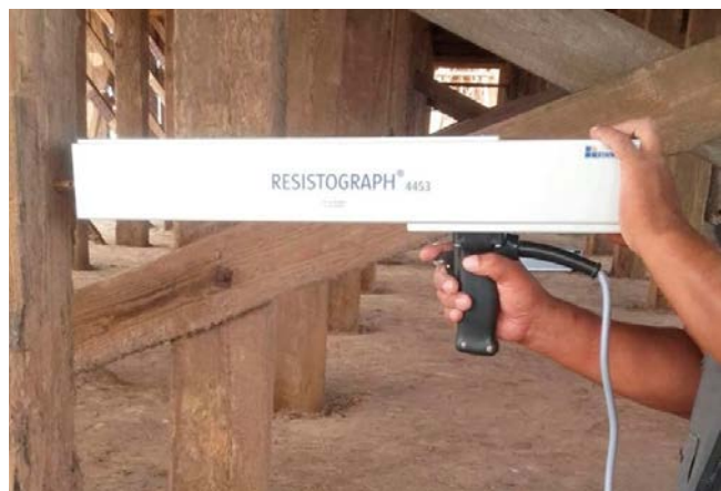
Figura 2. Medición resistográfica.

transductores de 54 Khz. Las mediciones de contenido de humedad se realizaron mediante un xilohigrómetro Minipa modelo MWD-14A.