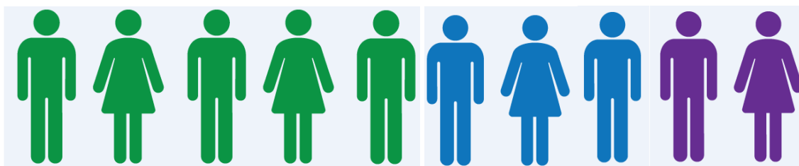
Tabel 1: Aantal individuele medewerkers per locatie (situatie oktober 2018)

Gezien het belang van ministeriële kabinetten mag het dan ook niet verbazen dat de regeringspartijen kunnen steunen op de grootste ploegen medewerkers . In oktober 2018 werden politici van N-VA en CD&V op nationaal, regionaal en Europees niveau ondersteund door meer dan 500 medewerkers. Naast de kabinetsmedewerkers zorgen uiteraard ook het grote aantal verkozen parlementsleden bij die partijen voor een hoger aantal medewerkers. Bij oppositiepartijen Sp.a en Groen, die over minder verkozenen beschikten, was dat beduidend minder. In tegenstelling tot Groen kreeg Sp.a in die periode wel ondersteuning via 1 Brussels ministerieel kabinet (Pascal Smet). Gezien VB niet deelnam aan het onderzoek, maakte ik een voorzichtige, geïnformeerde inschatting op basis van de parlementaire criteria voor personeelstoewijzing en de publieke boekhouding van de partij.