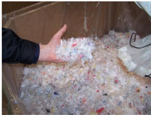
Gambar 1. bahan baku setelah dicacah

Dalam penelitian disiapkan bahan baku berupa sampah plastik khusus jenis poliethylen (HDPE) yang sudah dibersihkan dan dicacah dengan ukuran lebih kurang 1 cm, bahan ini kemudian dimasukkan dalam Tanki baja dan ditambahkan katalis Silica Alumina sebanyak 1,5% ( 60 gram ) dari bahan baku plastik yang dipakai, dengan proses pemanasan menggunakan bahan bakar LPG. Dari penelitian yang dilakukan oleh Ekki (2016), pengaruh suhu dan rato