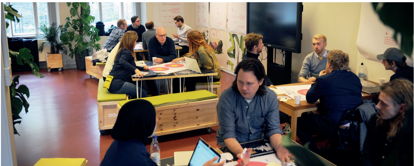
Datasprint faciliteres igennem designspil på første dag

Fake news hænger meningsfuldt sammen med det digitale, men man kan så spørge sig selv, hvad socialvidenskaben og laboratorier har med dette hypede begreb at gøre? Hvis man spørger os, fem kandidatstuderende på Techno-Anthropology fra TANT-Lab AAU, får man en længere historie, der starter i Amsterdam og fortsætter på Digital Social Science Lab (DSSL) i en såkaldt datasprint, hvor netop fake news blev undersøgt digitalt med socialvidenskabelige øjne i et workspace, vi kalder et lab.