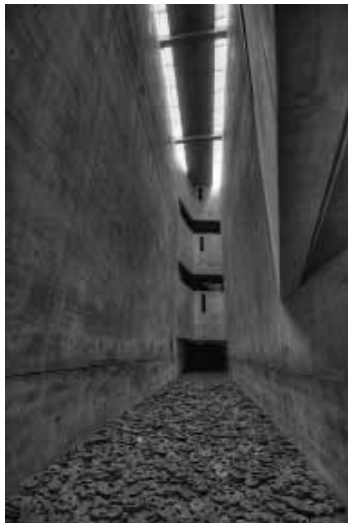
Figura 1. http://kberry.wordpress.ncsu.edu/2012/11/13/4/