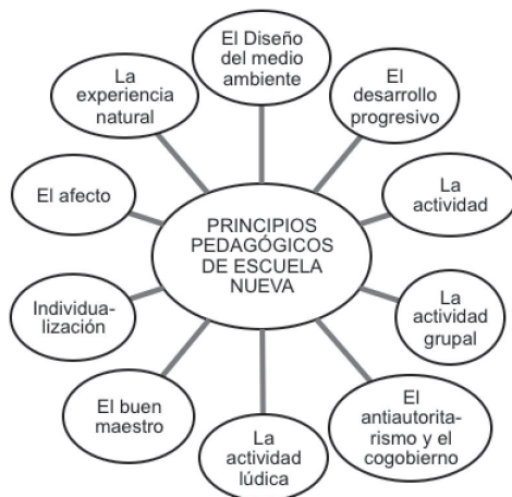
Gráfica 2. Principios pedagógicos en Escuela Nueva

Diseño de gráfica: Autores del presente trabajo.