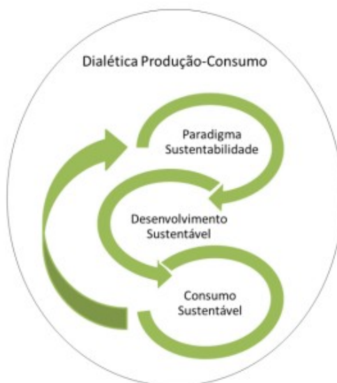
Figura 2: A dialética da produção-consumo sustentável