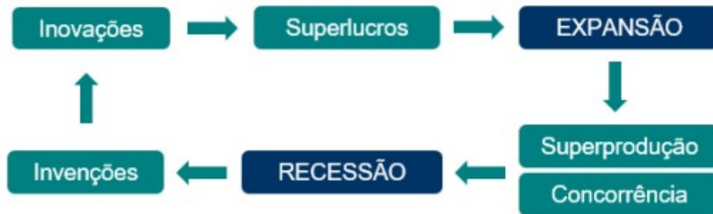
Figura 1: A dinâmica do ciclo de Kondratiev