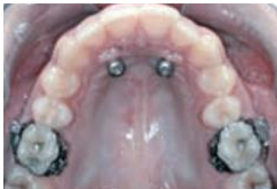
Figura. 3 – Parafusos implantados no palato previamente ao aparelho Pêndulo (FUZIY et al., 2008)