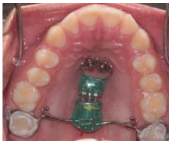
Figura 8 - Aparelho Screw-Dis instalado (ANDRE et al., 2011)

A força de distalização deve ser aplicada acima do centro de resistência do dente, para evitar um movimento indesejado de rotação e inclinação da raiz dos molares para mesial. Os braços de conexão às bandas devem estar de 1 a 2 mm afastados do palato para não causar traumas nos tecidos em seu percurso distal (correção da relação molar). Os braços de conexão são posicionados nos segundos molares; isso se deve a memória das fibras transeptais que auxiliam no movimento distal dos primeiros molares, como se fossem tracionados por essas fibras acompanhando os segundos molares distalizados pelos braços de conexão. Mais uma vantagem desse dispositivo, além de sua distalização sem resultantes anteriores e inclinações pendulares dos segundos molares, é o seu uso em uma segunda fase do tratamento, como ancoragem na distalização dos primeiros molares, pré-molares e caninos superiores (ANDRE et al., 2011) (Fig.8).