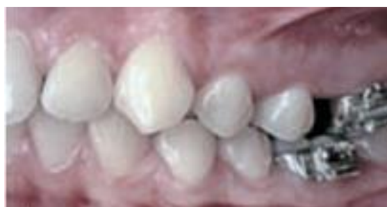
Figura 5c – Fotografia intrabucal lateral esquerda após 6 meses de tratamento (FUZIY et al., 2008).