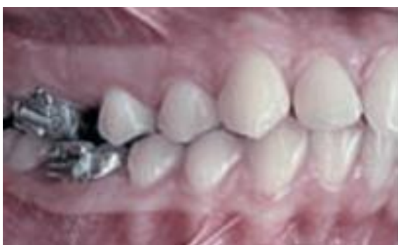
de tratamento (FUZIY et al., 2008).

Distal Jet é um aparelho fixo que produz distalização de molares uni ou bilateralmente e consiste em um sistema de pistão e tubo, podendo o tubo estar embutido em um botão de acrílico localizado no palato, possuindo apoio nos segundos ou primeiros pré-molares (NGANTUNG et al., 2001). A dificuldade em se higienizar o Distal Jet, devido a presença de acrílico na região palatina, levou a confecção de um Distal Jet sem material acrílico nesta região (Fig. 6), sendo ancorado em mini-implantes fixados no palato (Fig. 7), permitindo uma ancoragem absoluta para o movimento de distalização de molares e maior facilidade para higienização do local (KINZINGER et al., 2008).