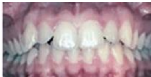
Figura 4a – Fotografia intrabucal inicial frontal de paciente classe II (FUZIY et al., 2008).