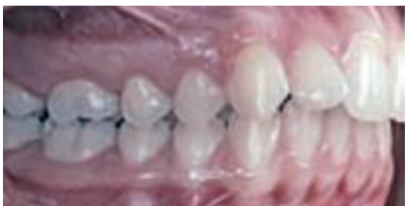
Figura 4b – Fotografia intrabucal lateral direita de paciente classe II (FUZIY et al., 2008).