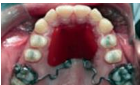
Figura 5a – Fotografia intrabucal após 6 meses de tratamento (FUZIY et al., 2008).

O aparelho de pêndulo com ancoragem esquelética é um método eficaz para a distalização dos molares superiores, pois controla a perda de ancoragem indesejada observada nos métodos convencionais (KIRCALI e YUKSEL, 2019).