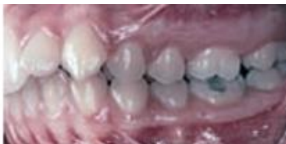
Figura 4c – Fotografia intrabucal lateral esquerda de paciente classe II (FUZIY et al., 2008).

Lombardo et al. (2019) apresentaram um caso clínico onde o aparelho pêndulo associado à mini-implantes no palato e disjutor foi utilizado, possibilitando a correção de má oclusão de Classe II, divisão 2 com discrepância transversal. O tratamento foi realizado com segurança e resultados positivos foram alcançados sem perda de ancoragem e sem necessidade de cooperação paciente.