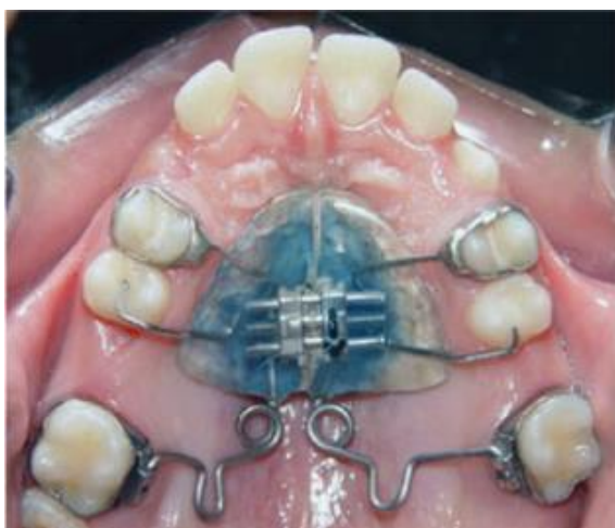
Figura 1 – Vista oclusal de molares distalizados após 5 meses de uso do aparelho Pendex (SANTOS et al., 2007)

Na busca por um método de tratamento que não promovesse alterações no arco inferior e que não dependesse da cooperação do paciente, Hilgers, em 1992, descreveu um mecanismo que produzia a distalzação de 5mm dos molares superiores, em 3 a 4 meses. O aparelho é composto por duas molas distalizadoras construídas com um fio de titânio-molibdênio de 0,032" de diâmetro, adaptadas aos tubos linguais dos primeiros molares permanentes e com um botão palatino de Nance como ancoragem. A fixação poderia ser realizada por meio de bandas nos primeiros pré-molares e grampos de apoio oclusal na crista marginal mesial do segundo pré-molar ou, simplesmente, por grampos de apoio oclusal, tanto no primeiro pré-molar quanto no segundo. Caso fosse necessária a expansão do arco superior, era incorporado um parafuso expansor no centro do botão de acrílico, recebendo a denominação de Pendex. (Fig. 1).