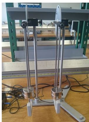
Figura 1. Arranjo experimental montado.