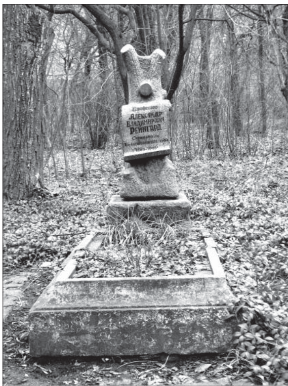
Могила О.В. Рейнгарда на території Ботанічного саду ДНУ імені Олеса Гончара.