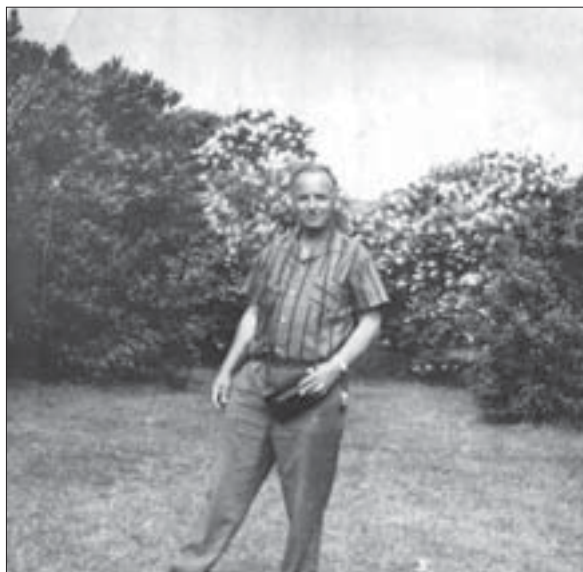
Біля улюбленого бузку, 1969 р.