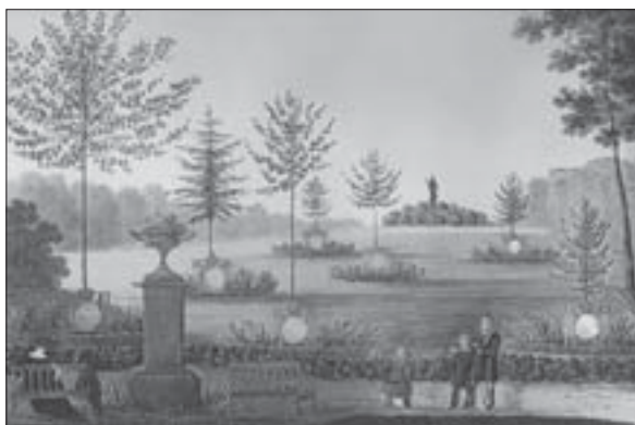
Рис. 5. Елементи індивідуального догляду за деревами за часів Браницьких

Олександром I. Вік — близько 200 років. Обхоп стовбура — 5,1 м. Висота — 37,0 м.