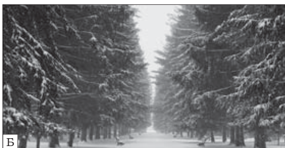
Рис. 7. Ялинова алея: А — в Павловську; Б — у дендропарку «Олександрія», відновлена в 1975 р.

практично розпалися рядові посадки із сосни веймутової на Ялиновій алеї. Загинула Соснова алея та вікові сосни на алеї Любові. На межі загибелі перебуває 100-річна Ялинова алея у західній частині парку.