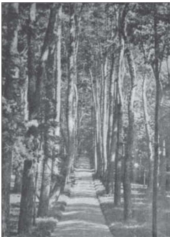
Рис. 3. Соснова алея на початку ХХ ст.

Таке безцінне дендрологічне багатство потребує особливої уваги, догляду і дбайливого ставлення. Вікові дерева є предметом поглиблених наукових досліджень. Вивченню питань відмирання діброви і розробці методів її збереження та відновлення присвячено кілька п'ятирічних наукових тем дендропарку «Олександрія» [25, 26]. Велику увагу приділено вивченню фітоценотичного складу діброви [4]. Протягом останнього часу вивчалися наслідки тривалого антропогенного втручання в цілісність діброви [14], поточний відпад дубів [10].