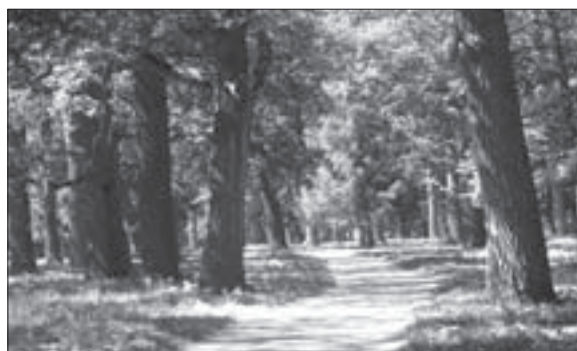
Рис. 1. Вікова діброва дендрологічного парку «Олександрія» НАН України

До наших днів у ландшафтах парку з рослин, висаджених за часів засновників парку, збереглося 220 інтродукованих листяних дерев (12 видів) і 600 хвойних дерев (7 видів), зокрема, листяні: Acer pseudoplatanus L., Celtis occidentalis L., Cornus mas L., Robinia pseudoacacia L., Fagus sylvatica L., Quercus rubra L., Aesculus hippocastanum L., Juglans nigra L., J. regia L., Liriodendron tulipifera L., Syringa vulgaris L., Pirus communis L., Tilia euchlora C. Koch. тощо; хвойні: Picea abies (L.)