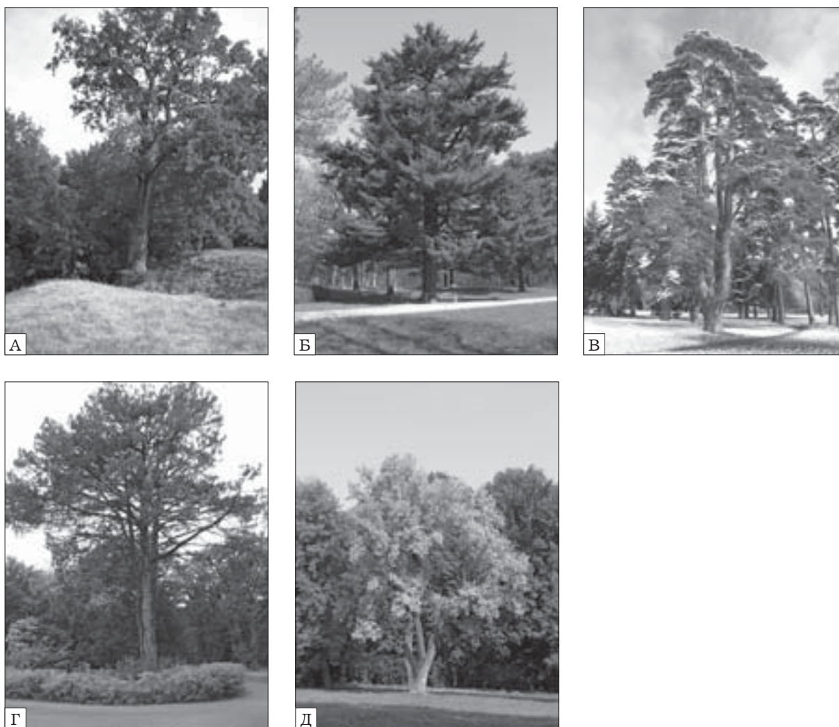
Рис. 4. Меморіальні старовікові дерева в дендропарку «Олександрія»: А — дуб Семена Палія; Б — сосна Веймутова — дарунок Катерини II; В — родинне дерево Браницьких — сосна звичайна; Г — «Три грації»; Д — тюльпанове дерево

виду, які подарувала імператриця Катерина II Олександрі Браницькій на початку закладання парку в м. Біла Церква (не пізніше 1796 р.). Вік — близько 230 років. Обхоп стовбура — 3,95 м. Висота — 27,0 м. Зростає на Великій галявині.