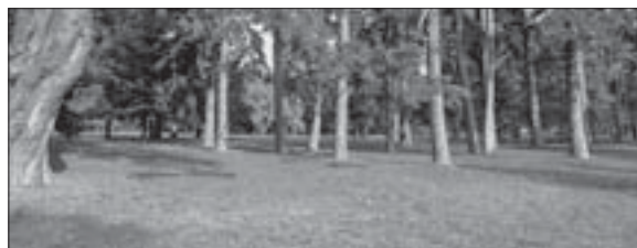
Рис. 2. Група вікових дерев сосни звичайної на Великій галявині

Karst. , Pinus nigra Arn., P. strobus L., Larix polonica Racib. ex Szaf., L. sibirica Ledeb., L. decidua Mill., Juniperus virginiana L.