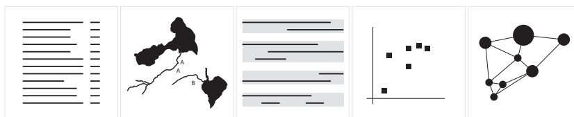
Abbildung 1: Diagrammatische Grundfiguren Listen, Karten, Partituren, Vektoren und Graphen

Es existieren verschiedene Versuche, Diagramme zu klassifizieren (Ber- tin 1967; Kucher & Kerren 2015; Sauerbier 2009; Stewart 1976; Tufte 1983; Unwin et al. 2006). Wenn man Diagramme jedoch in einem weiten Sinn als kulturell geprägte grundlegende Mittel der Datentransformation betrachtet, scheinen mir viele Klassifikationen zu detailliert oder zu ein- geschränkt bezüglich ihres Diagrammbegriffes zu sein. Mit Blick auf die Linguistik habe ich deshalb fünf diagrammatische Grundfiguren vorge- schlagen, die sprachliche Daten auf je unterschiedliche Art transformieren und wichtig für die Konstruktion linguistischer Untersuchungsgegenstände sind: Listen, Partituren, Karten, Vektoren und Graphen (ausführlich: Bubenhofer, in Vorbereitung, 2018b, 31).