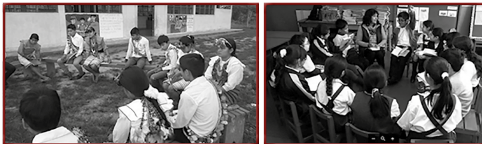
Figura 3. Realización de Tertulia Literaria en el CRFA Balsapuerto de la comunidad Shayahuita de Puerto Porvenir, provincia de Alto Amazonas (izquierda) y en el Colegio María Parado de Bellido, Barrios Altos - Cercado de Lima (derecha)