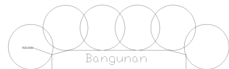
Gambar 2. Daerah perlindungan bangunan

Melalui perhitungan dari persamaan tersebut, maka selanjutnya akan dapat diketahui untuk nilai proteksinya sesuai tabel 1. Jika nilai efisiensi ( E ) pada bangunan bernilai 0,96, maka sesuai tabel 1 akan diketahui tingkat proteksinya yaitu berada pada tingkat proteksi I. Sesuai SNI 03-7015-2004, bangunan area kerja perusahaan fabrikasi boiler ini membutuhkan tingkat proteksi level I yang berarti radius bola R = 20 m. Metode Rolling Sphere dilakukan dengan cara menggambarkan bangunan dan bola bergulir. Daerah antara perpotongan permukaan tanah, gedung dan keliling bola bergulir dan bangunan itu sendiri adalah daerah proteksinya. SNI 03-7015-2004, maka akan tampak daerah perlindungan sebagai berikut :