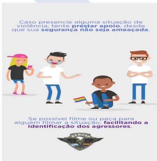
Figura 3 - Folder sobre como reagir em caso de agressões ao público LGBTQ+

Agamben (2002) compreende algumas contradições que as estratégias biopolíticas ostentam, pois existem dois lados referente à atuação desse biopoder, se de um lado o governo propõe medidas de cuidado com a vida de uma parcela da população, do outro, o próprio governo intensifica técnicas para eliminar os sujeitos marginalizados pela sociedade, sejam eles: negros, indígenas ou LGBTQ+. Nas palavras do autor supracitado, “[...] ‘o belo dia’ da vida só poderá obter cidadania política através do sangue e da morte ou na perfeita insensatez a que a condena na sociedade do espetáculo” (AGAMBEN, 2002, p. 19).