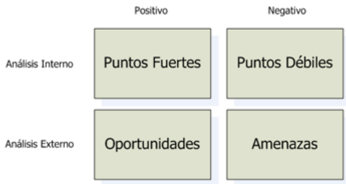
Gráfico 1: Análisis DAFO

y que afectan directamente al funcionamiento del negocio. ¿Qué es el análisis DAFO? El análisis está basado en las Debilidades, Amenazas, Fortaleza y Oportunidades que posee la empresa, de ahí las siglas de su nombre DAFO. El análisis DAFO se realiza observando y describiendo (es un análisis cualitativo) las características del negocio y del mercado en el cual se encuentra, el análisis DAFO permite hallar las Fortalezas de la organización, las Oportunidades del mercado, las Debilidades de la empresa y las Amenazas en el entorno. Muñiz, L. (2014, p.25)