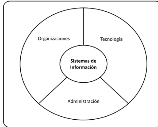
Figura 3. Dimensiones de un sistema de información

Revista Publicando, 4 No 10. (2). 2017, 368-382. ISSN 1390-9304