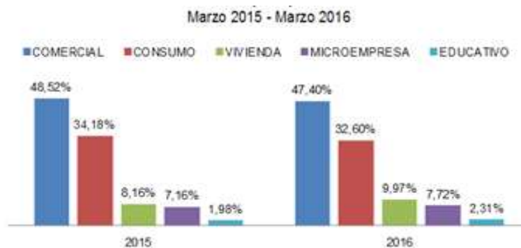
Gráfico 1: Cartera bruta por tipo de crédito

En base a estadísticas realizadas en el año 2016 por la Dirección Nacional de Estudios en Información, considerando como base los datos proporcionados por las entidades controladas por la Superintendencia de Bancos en el Ecuador c , tenemos que el 48,52% del volumen monetario de la cartera de créditos están destinados a créditos comerciales d , siendo en estas entidades, los estados financieros requisitos necesarios para determinar su liquidez, solvencia y calidad económica del sujeto crediticio. En consecuencia tenemos que estos créditos tienen la mayor participación en el portafolio de cartera de las instituciones bancarias, de ahí su principal importancia de estudio.