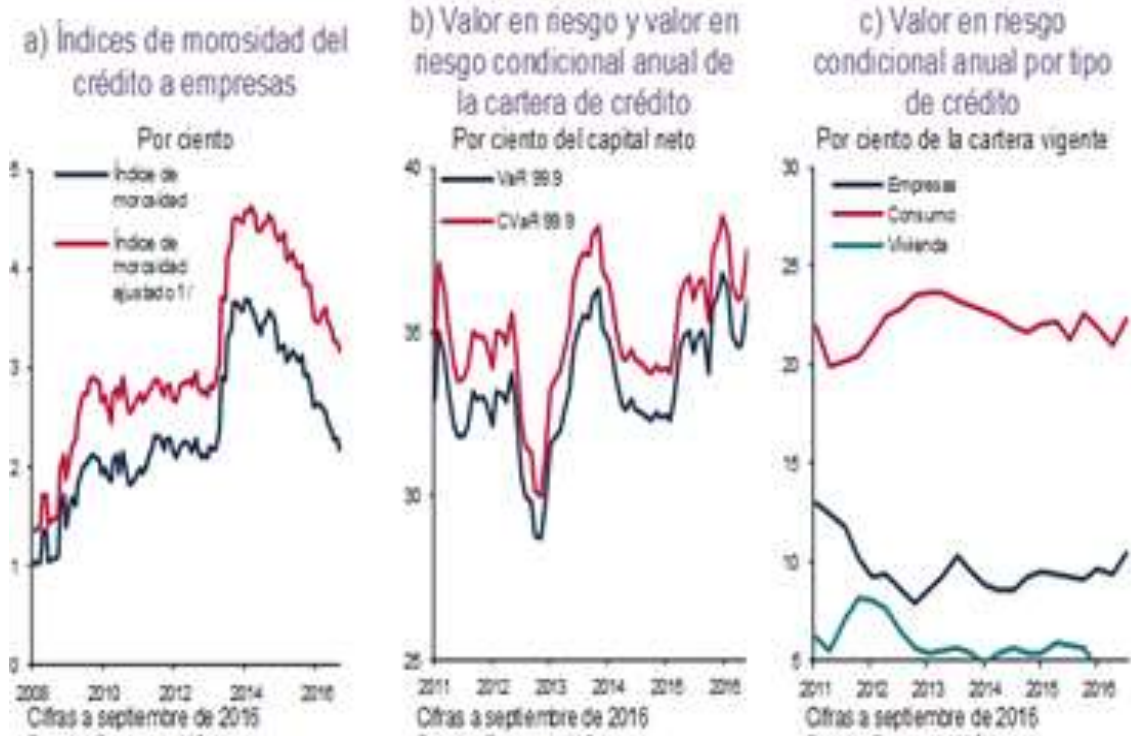
Gráfico 2: Indicadores de riesgo de crédito de la banca comercial

Revista Publicando, 5 No 15. (2). 2018, 1279-1294. ISSN 1390-9304