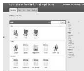
Gambar 3. Halaman awal backend