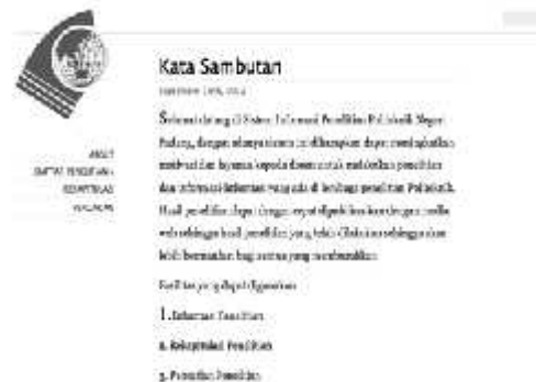
Gambar 4. Halaman awal