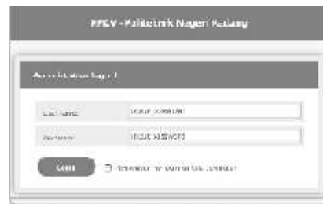
Gambar 2. Login