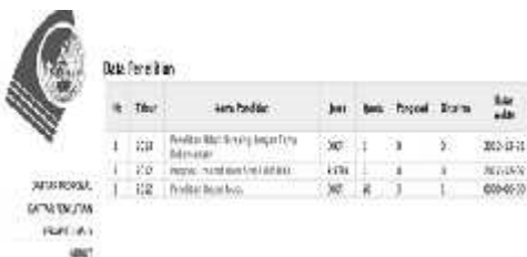
Gambar 6. Tampilan penelitian