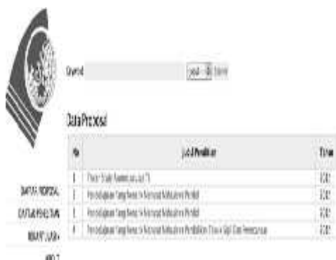
Gambar 5. Halaman proposal