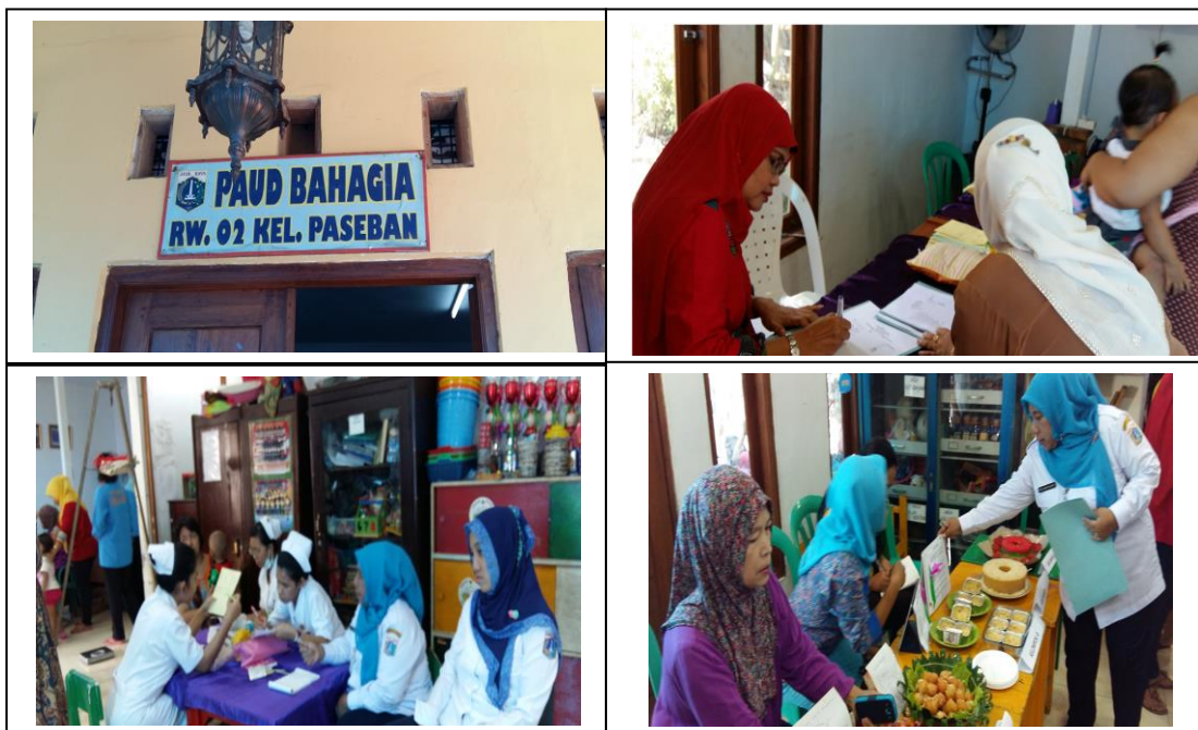
Gambar 4. Kegiatan yang bersamaan dengan mewarnai gambar pada kantor RW-02 di PAUD BAHAGIA, Kelurahan Paseban.