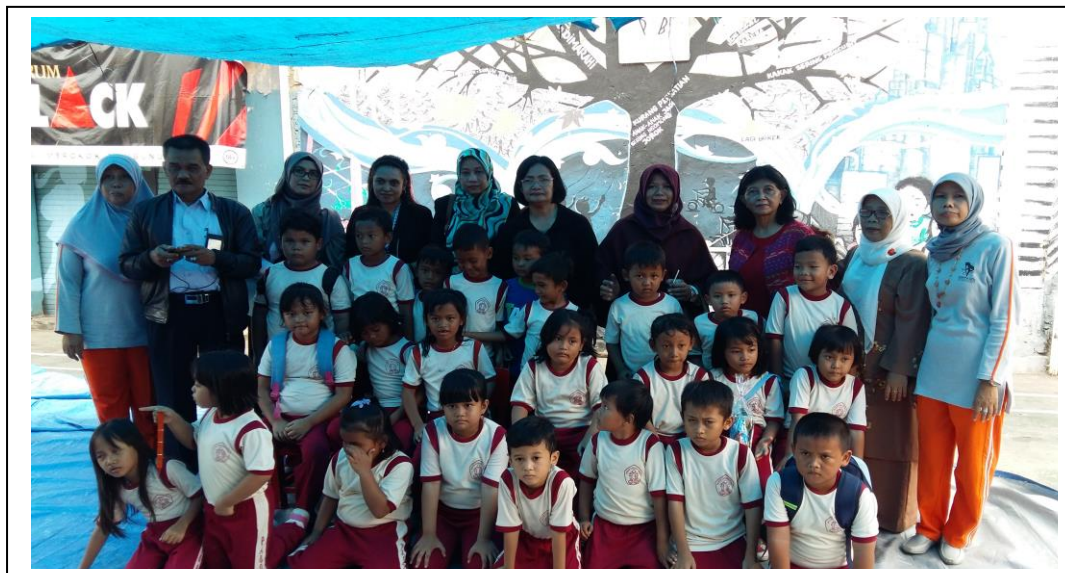
Gambar 8: Pak RW dan Keluarga PAUD BAHAGIA, Panitia serta guru –guru

dalam acara kegiatan yang berbeda. Foto bersama dengan peserta mewarnai terdiri dari anak-anak PAUD BAHAGIA serta panitia, guru-guru, tersaji pada gambar 8