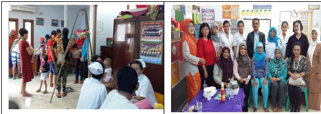
Gambar 6 Kegiatan penyuluhan gizi untuk anak tersaji pada gambar.

penimbangan berat badan oleh tenaga medis dari Puskesmas kecamatan Senen. Kegiatan anak balita tersaji pada gambar 6.