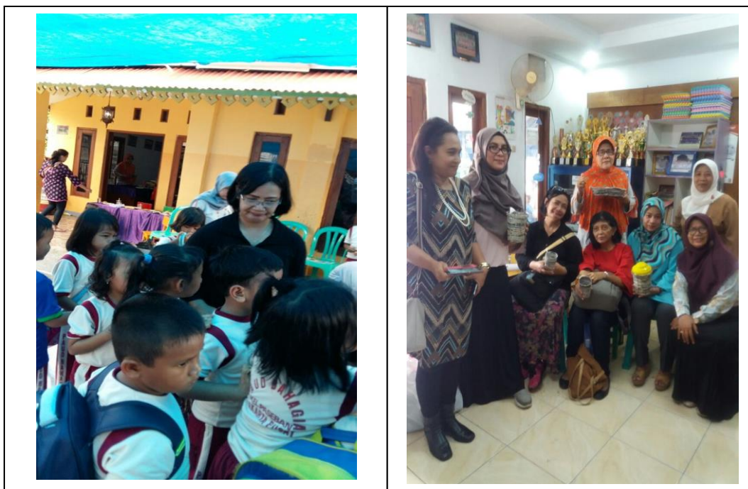
Gambar 2. Pencerahan bersama Narasumber, Penulis dan Warga.