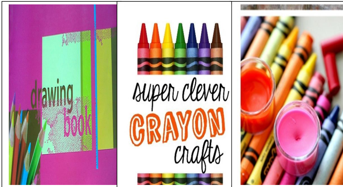
Gambar 3. Alat Untuk mewarnai Kertas gambar A3 dan Crayon.

Setelah selesai diadakan pencerahan oleh narasumber dan penulis mengarahkan kepada anak-anak peserta di kelurahan Paseban khususnya di warga RW-02 untuk melakukan praktek sendiri dalam mewarnai gambar-gambar dengan Crayon yang sudah dibagikan pada seluruh peserta. Pengabdian Pada Masyarakat kali ini mengambil Tema Mencintai Lingkungan “ di Rw - 02 dengan “Tema Mencintai Lingkungan “ yang dilaksanakan pada Tanggal 12 Mei 2017.