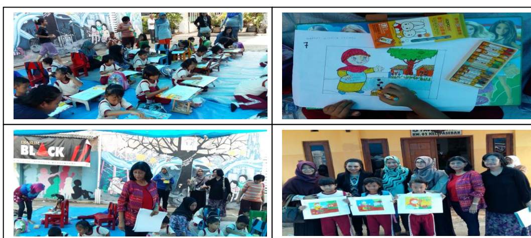
Gambar 5. Mewarnai gambar dengan menggunakan Gambar A3 dengan Crayon

Kegiatan mewarnai gambar diikuti anak-anak PAUD BAHAGIA RW - 02 Kelurahan Paseban sejumlah 20 orang dari PAUD BAHAGIA sejumlah 10 orang. Diluar PAUD BAHAGIA. Dalam Kegiatan ini yang diizinkan untuk ikut adalah kelompok usia 3 sampai dengan 6 tahun. Gambar 5. Kegiatan pelaksanaan Mewarnai gambar dengan menggunakan Gambar kertas A3 dan Crayon. Kegiatan mewarnai dan hasil akhir tersaji pada gambar 5.