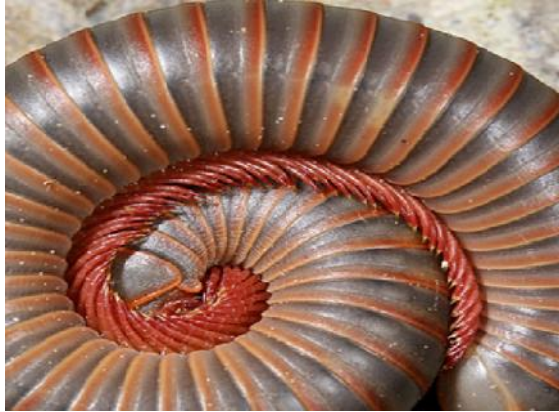
Gambar 4. Ruas Tubuh Diplopoda yang mirip dengan Spiral Theodorus

kemiripan dengan Spiral Theodorus . Terlihat dari gambar berikut: