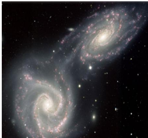
Gambar 5. Colliding Galaxies mirip dengan Spiral Theodorus

kemiripan dengan Spiral Theodorus . Hal ini dapat dilihat dari gambar berikut: