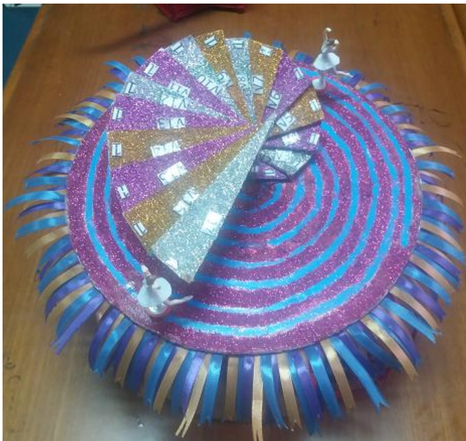
Gambar 9. Kotak Musik Ketiga Spiral Theodorus Karya Mahasiswa Semester 1 Prodi Pendidikan Matematika Universitas Kristen Indonesia (UKI)

Kotak musik yang ketiga memiliki tema yang sama dengan kotak musik yang kedua yaitu Barbie , namun demikian bentuknya berbeda dengan kotak musik yang kedua. Masing-masing kotak musik memiliki keunikan masing-masing baik dari bentuk, warna, tema. Hal ini semata-mata dilakukan untuk membuat kotak musik yang bervariasi, sehingga dapat menarik perhatian siswa sekolah untuk menggunakan kotak musik Spiral Theodorus untuk mengingat teorema Pythagoras .