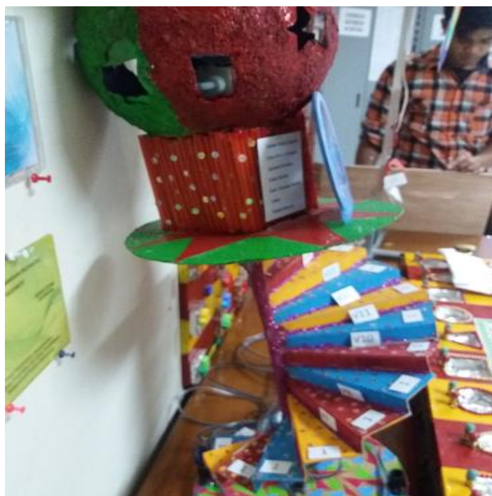
Gambar 7. Kotak Musik Pertama Spiral Theodorus Karya Mahasiswa Semester 1 Prodi Pendidikan Matematika Universitas Kristen Indonesia (UKI)

membuat kotak musik Spiral Theodorus . Kotak musik ini diharapkan dapat meningkatkan pemahaman siswa untuk teorema Pythagoras .