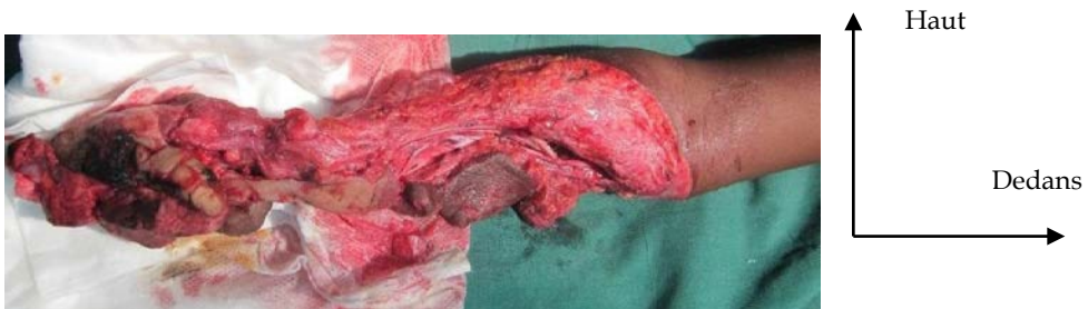
Figure 1 : Lésions d'écrasement de l'avant-bras droit par engrenage de moulin.