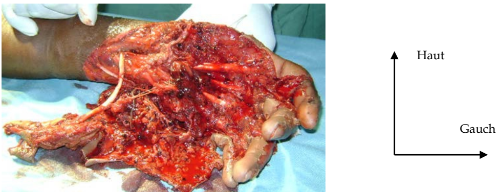
Figure 2 : Lésions d'écrasements de la main gauche par accident de la voie publique chez un garçon de 10 ans (image du service de chirurgie pédiatrique du CHU Sylvanus Olympio (Lomé).