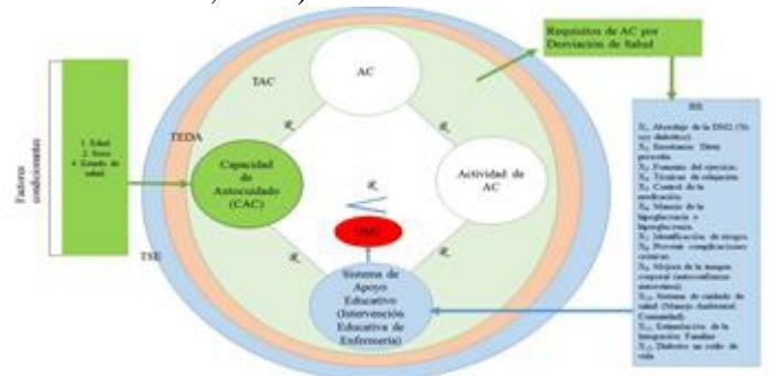
Figura 2. Intervención educativa de Enfermería según TSE (Sistema de Apoyo Educativo) utilizando el método “Enseñar”.

La intervención educativa de enfermería consta de 12 sesiones (una semanal) con un tiempo promedio de 120 minutos cada una, estableciendo un total de 1,440 minutos para la intervención; la IEE tiene en su contenido los requisitos para el AC por desviación de salud y los FCB de la sub-teoría del AC de Dorothea Orem; así mismo se plantearon de acuerdo a las intervenciones de enfermería del programa de atención a las enfermedades metabólicas legitimado por la NOM-015-SSA2-2010 para la prevención, tratamiento y control de la DM, los factores protectores señalados por la OMS y las investigaciones descritas en el marco empírico (Ver Figura 2), las sesiones planteadas se detallan a continuación (Fernández, 2010; Rodríguez & Vallenilla, 2007; Ávila, Meza, Frías, Sánchez, Vega & Hernández, 2006; Lezama, Malavé & Tovar, 2005).