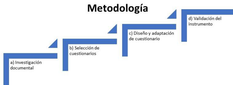
Figura 1. Metodología utilizada (Elaboración propia)

La metodología utilizada para la elaboración de este instrumento fue la siguiente (Figura 1).