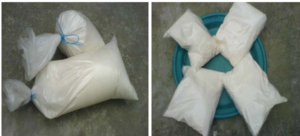
Figure 3: Sachets de granulés de manioc natif

Les granulés produits puis conditionnés dans des sachets de polyéthylène de 160 µm d'épaisseur et conservés à température ambiante dans un endroit sec, pendant 2 ans, se présentent sans reprise d'humidité notable. Un échantillon de granulés de manioc natif est présenté sur la figure 3.