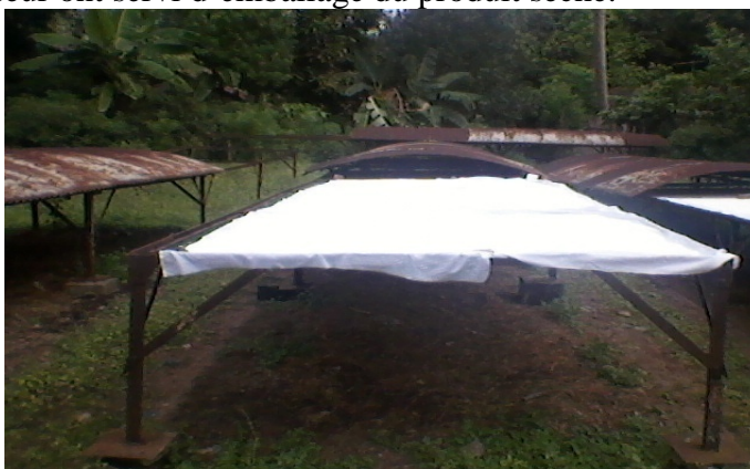
Figure 2: Séchage des granulés de manioc natif

La pâte pressée est émietée à la main dans une cuvette et l'on procède à la granulation en la faisant passer au travers d'un tamis en fibre végétal. Les grains obtenus sont séchés pendant 2 jours au soleil, sur une claie de 80 cm de hauteur, sur laquelle est apposé un grillage de maille 2 cm, recouvert d'une toile de tissu (Figure 2). Des sachets de polyéthylène de 160 \mu\text{m} d'épaisseur ont servi d'emballage du produit séché.