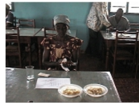
Photo 4 : Séance de dégustation du manioc issu du champ expérimental