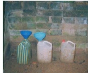
Photo 2 : Une latrine Ecosan Photo 3 : Urinoirs Ecosan Photo 4 : Bidons d'urine "Bidurs"