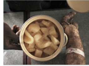
Photo 2 : Ragoût du tubercule de manioc issu du champ expérimental