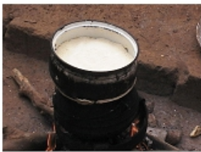
Photo 3 : Cuisson de la semoule de manioc issu du champ expérimental