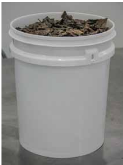
Figura 19. Baldes para acondicionamento de própolis nova

Também poderão ser utilizados baldes plásticos, herméticos, de grau alimentício, de cor branca opaca (para não haver entrada de luz), com capacidade de até 10 kg de própolis (baldes para 20 litros), conforme Figura 19.