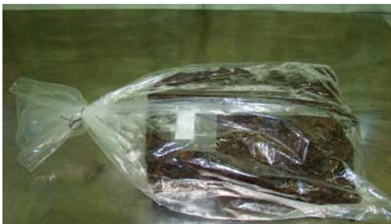
Figura 18. Acondicionamento de própolis em pacotes

Preferencialmente, colocar 5kg em cada pacote e acondicionar em caixas de papelão ao abrigo da luz e umidade. Procurar dar um formato retangular ao pacote para que possa ser melhor acondicionado e armazenado (Figura 18).