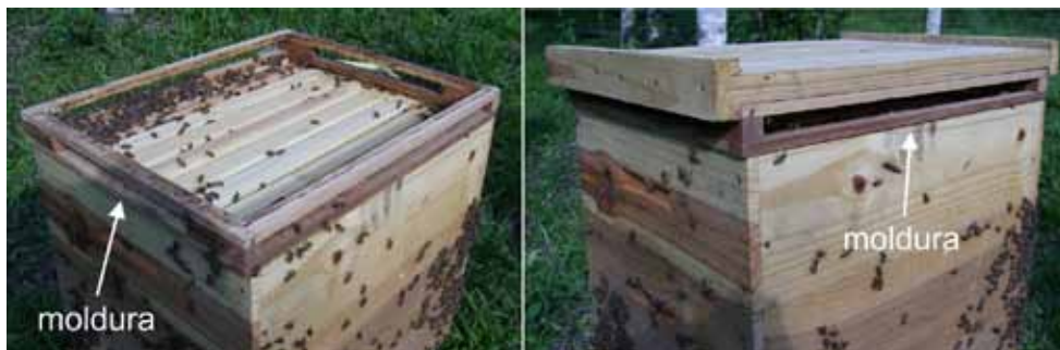
Figura 7. Coletor móvel interno (moldura)