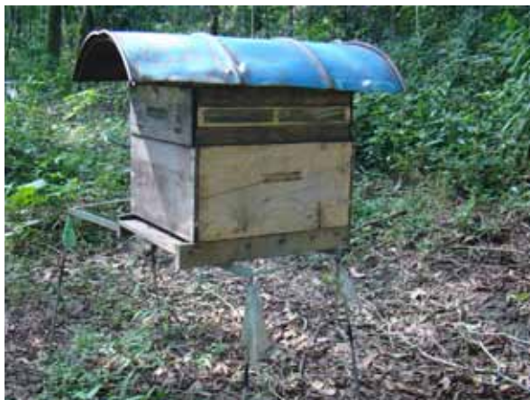
Figura 9. Colmeia com caixilho de própolis