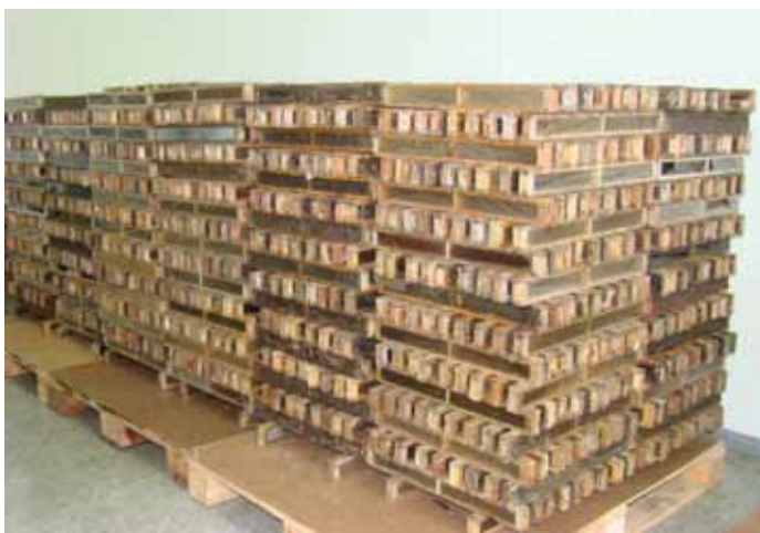
Figura 15. Disposição dos quadros de própolis para a manipulação

Chegando do apiário, as caixas contendo os quadros de própolis devem ser descarregados e levados ao local de processamento. Antes de qualquer manipulação, o apicultor ou a pessoa que irá manipular a própolis deverá tomar todos os cuidados de limpeza e higiene necessários tanto pessoal como do ambiente. Os quadros são retirados das caixas e gradeados na mesa ou prateleira para não haver aderência entre eles e para uma pré-secagem (Figura 15).