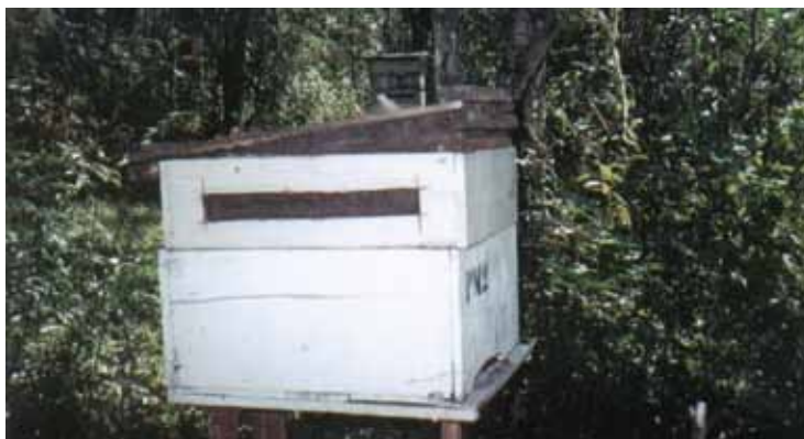
Figura 8. Aberturas laterais nas melgueiras

As condições criadas são similares das aberturas efetuadas calçando os componentes da colmeia, com a desvantagem de que são aberturas permanentes e que dificultam o transporte e o manejo das colmeias. Outra desvantagem é que a colheita da própolis precisa ser efetuada no apiário, dificultando as condições de trabalho limpo e higiênico.