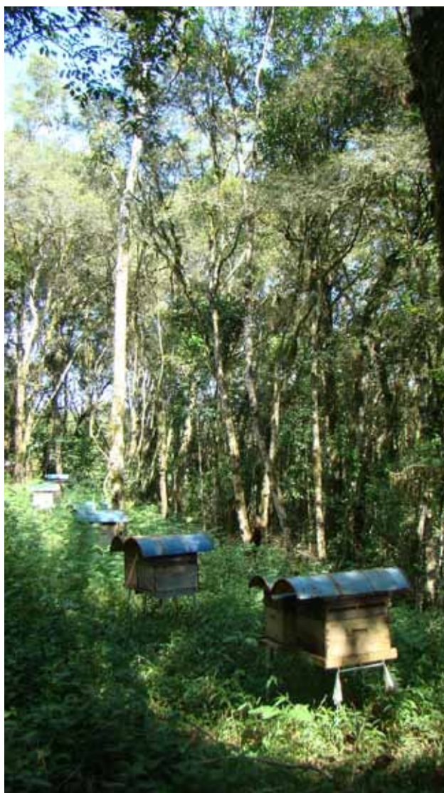
Figura 3. Localização do apiário

Recomenda-se deixar as colmeias protegidas do sol (meia sombra) nos períodos mais quentes do ano (Figura 3).