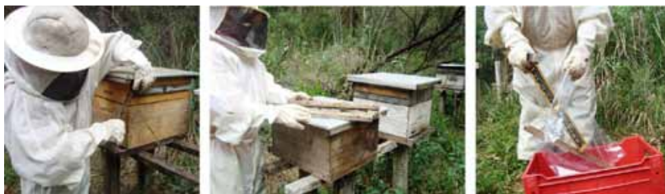
Figura 13. Colheita de própolis

Terminado este procedimento em todo o apiário, retorna-se coletando os quadros propolizados em pacote plástico atóxico e em caixa plástica adequada (Figura 13).