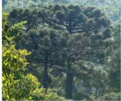
Figura 4. Plantas de interesse para a produção de própolis