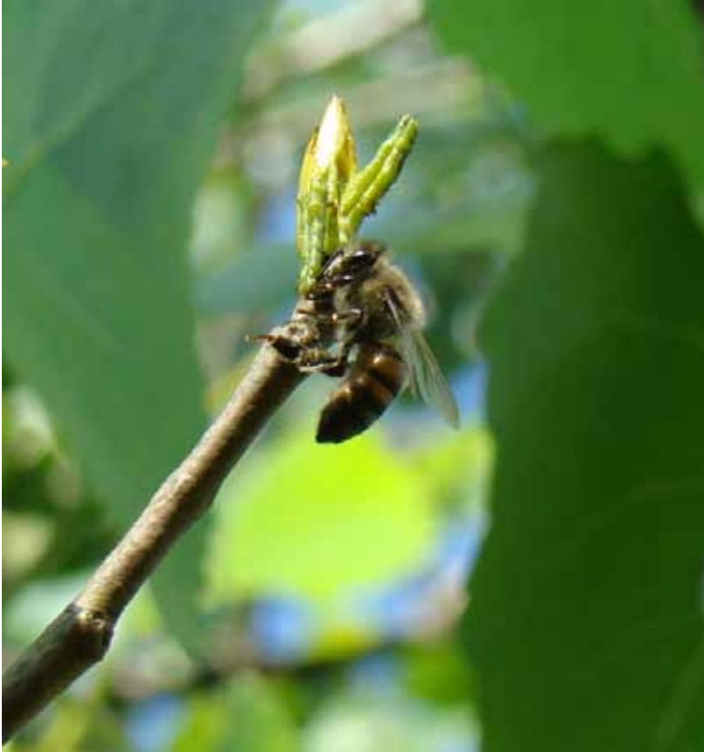
Figura 1. Abelha coletando resina para produzir própolis

Nesse processo acrescentam secreções salivares e grãos de pólen, quando presentes. Na colmeia, a resina é retirada da corbícula com auxílio de outras abelhas e manipulada com adição de cera, mais secreções salivares e eventualmente mais pólen.