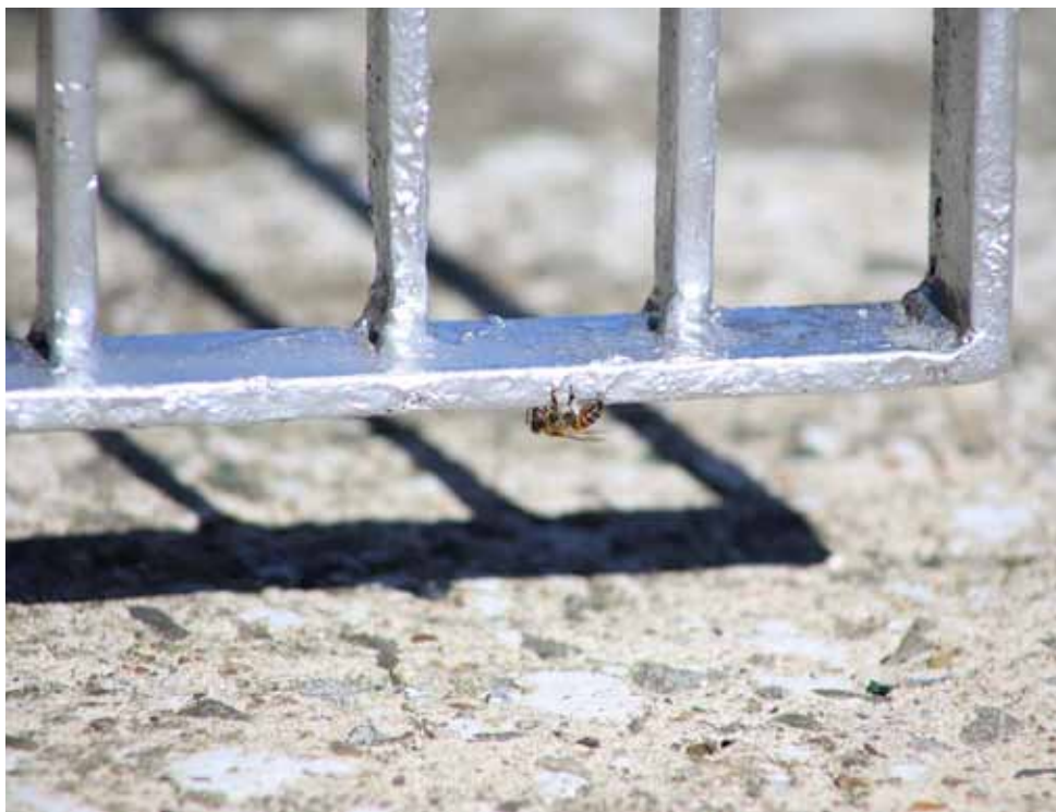
Figura 2. Abelha coletando tinta de alambrado

A localização do apiário deve ser em local com vegetação suficiente para atender a demanda das abelhas por néctar e pólen, distante de fontes indesejáveis que possam contaminar a própolis, como centros urbanos e estradas movimentadas. Eventualmente pode-se encontrar abelhas coletando tinta de alambrados e outras resinas artificiais que podem contaminar a própolis (Figura 2).