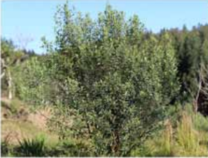
Viburnum (Gênero Baccharis )