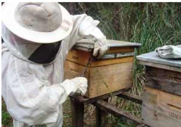
Figura 10. Retirada do caixilho de própolis