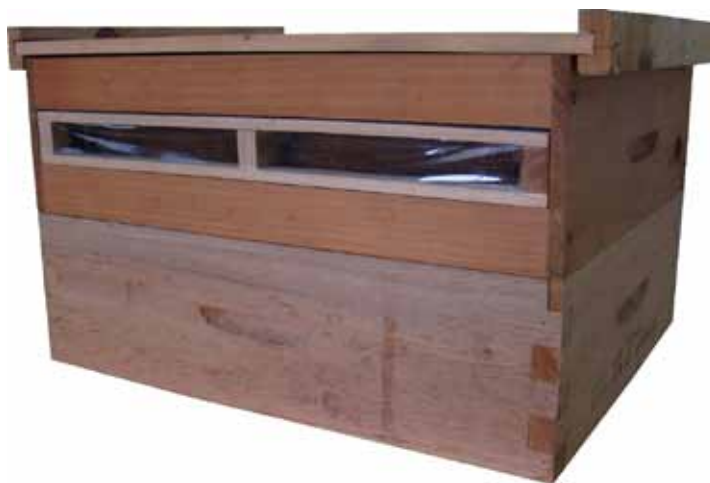
Figura 12. Caixilho de própolis com fita

Colar fita plástica adesiva (com largura de 50mm) manualmente numa das faces do quadro móvel. A madeira do quadro precisa estar bem limpa e seca para que haja aderência da fita. Gradear os quadros por alguns dias para que a cola exposta da fita seque, evitando que as abelhas fiquem aderidas (Figura 12).