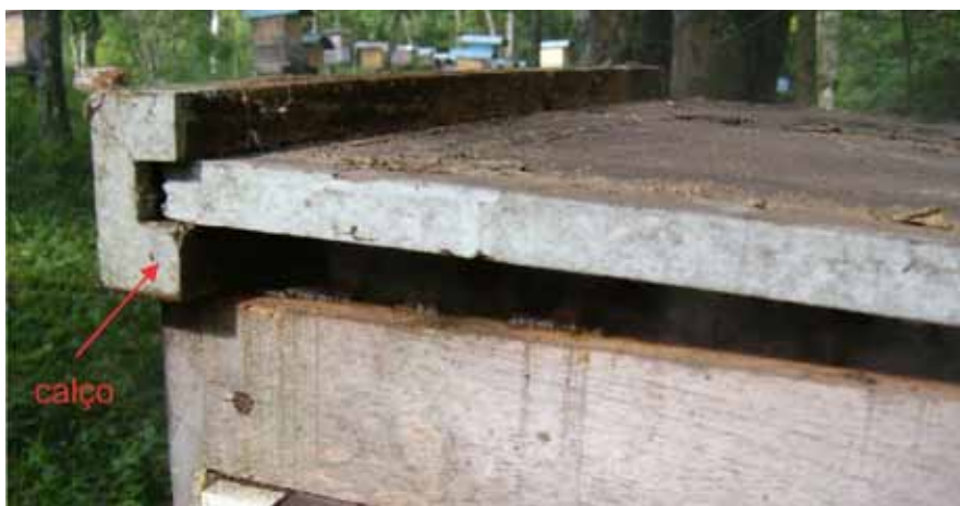
Figura 6. Calços em componentes da colmeia

Esse procedimento, apesar de bastante produtivo, cria condições muito desfavoráveis ao enxame, provocando desconforto às abelhas, além de dificultar o equilíbrio térmico e facilitar a entrada de outros insetos (formigas, vespas, aranhas, traças), e também de impurezas como poeira e folhas. Além disso, a colheita de própolis precisa ser efetuada no apiário, o que dificulta o trabalho do apicultor e proporciona menos higiene ao produto.