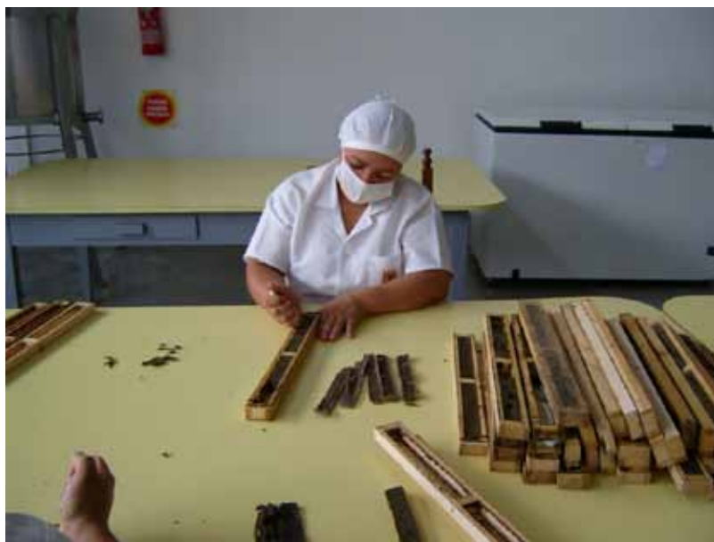
Figura 16. Retirada das tiras de própolis

No mesmo dia ou dias subsequentes, a própolis será cortada com faca afiada (lâmina encurtada de inox e afiada de um lado). Neste processo, evita-se cortar a fita plástica, assim como a madeira das laterais do quadro. Desta forma obtém-se tiras e pedaços praticamente limpos de impurezas (Figura 16).