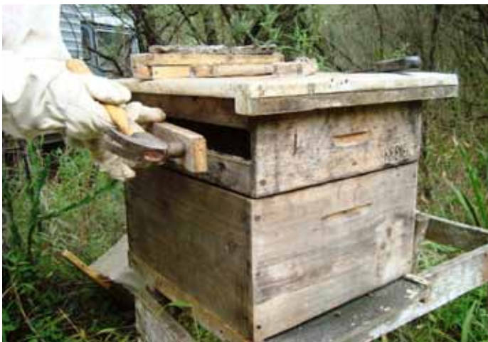
Figura 14. Fechamento do espaço do caixilho na melgueira

Terminado o período de produção de própolis (para a região sul do Brasil, com a chegada das primeiras frentes frias em meados de abril), são retiradas as melgueiras com os coletores. Nas colmeias mais populosas e com reserva de alimento na primeira melgueira, é retirado o quadro móvel e a abertura fechada com um tampo de encaixe justo (Figura 14). Este tampo não precisa ser pregado, pois será propolizado pelas abelhas. Nas próximas produções poderá ser retirado com facilidade.